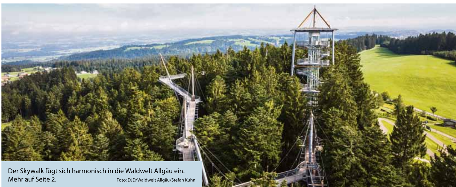
Der Skywalk fügt sich harmonisch in die Waldwelt Allgäu ein. Mehr auf Seite 2.