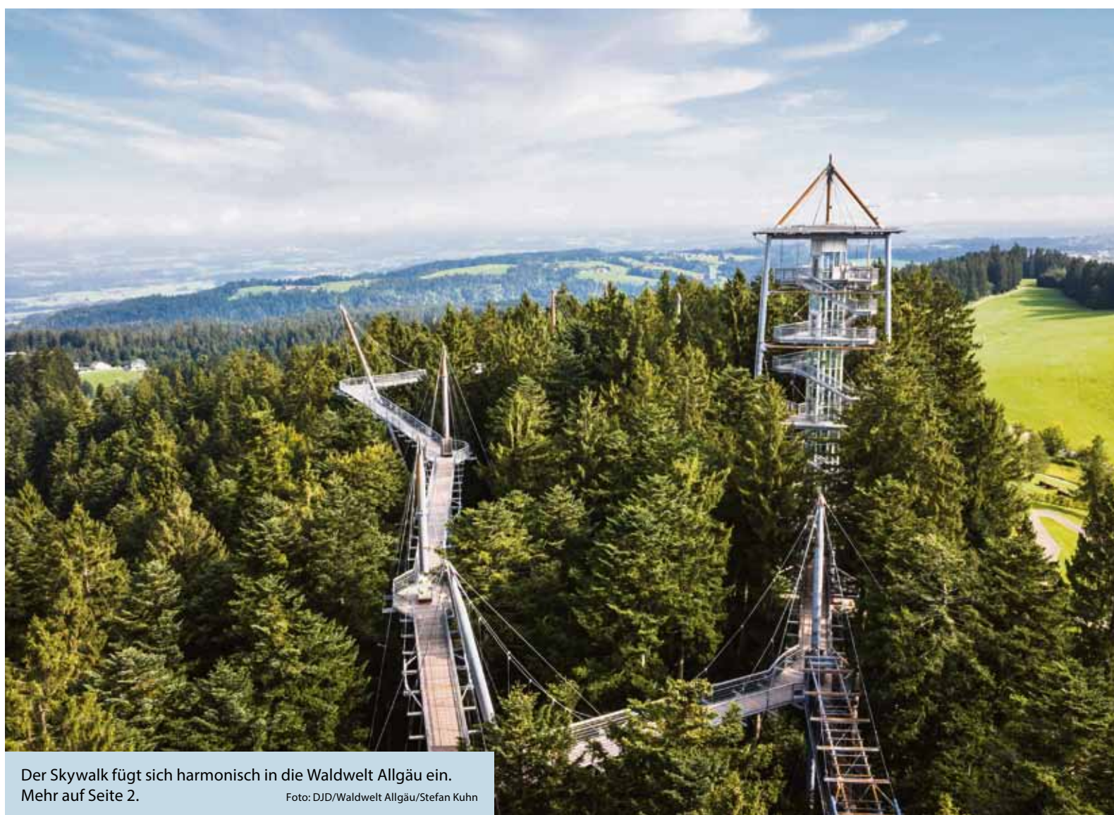
Der Skywalk fügt sich harmonisch in die Waldwelt Allgäu ein. Mehr auf Seite 2.