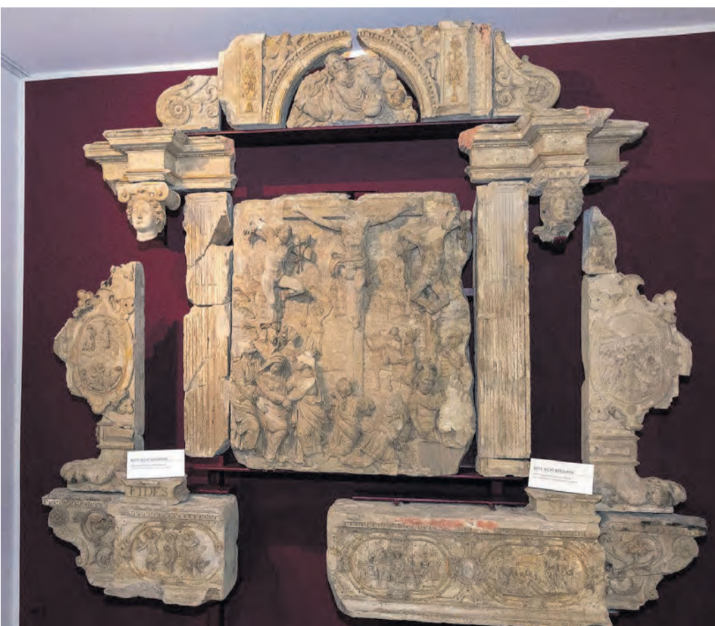
Ein Teil des ehemaligen Altares der katholischen Kirche in Rembrücken.

Rembrücken gestanden. Der Unterbau des Werks ist auch heute noch dort zu finden. Vermutet wird, weil er eventuell zu groß war und zudem nicht mehr zum neobarocken Stil der als Nachfolgerin der Rembrücker Kapelle errichteten Kirche Mariä Opferung passte, hat man den Altar zunächst irgendwo in Rembrücken gelagert. Etwa 1936 wurde er dann in den Mainzer Dom geschafft und geriet daraufhin in Vergessenheit. Durch einen Zufall wurde er dann im Ostturm des Mainzer Doms wiedergefunden und ist nun als Dauerleihgabe im Museum zu sehen.