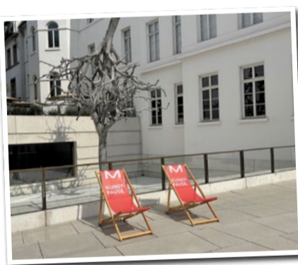
Liegestühle vor dem Jüdischen Museum Frankfurt.

Die Stühle können während der Öffnungszeiten kostenlos genutzt werden, etwa im Klosterrundgang des Karmeliterklosters, im Historischen Museum, im Jüdischen Museum und im Museum Angewandte Kunst. Die Sommeraktion läuft noch mehrere Wochen und lädt alle Vorbeigehenden zu einer kleinen „Kunstpause“ ein.