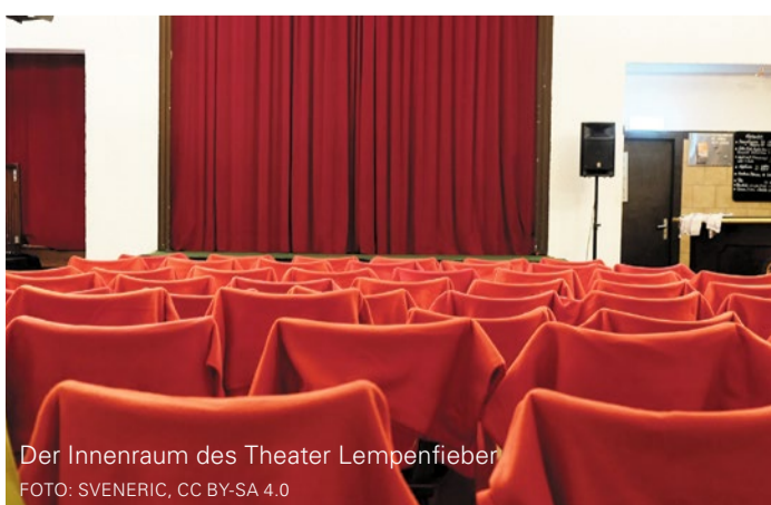
Der Innenraum des Theater Lempenfieber

Klein, fein und voller Leidenschaft: Das Theater Lempenfieber bringt Kultur mitten ins Viertel. Hier stehen keine gro-