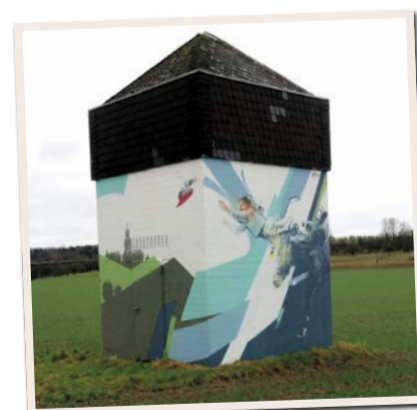
Das Azur-Häuschen in Berkersheim

Tief unter Berkersheim sprudelt etwas Besonderes: die Azur Quelle. Aus mehr als 100 Metern Tiefe wird hier reinstes Mineralwasser gefördert – direkt aus dem Frankfurter Boden. Die Quelle ist zwar nicht öffentlich zugänglich, aber ihr Wasser wird in der Region geschätzt und verteilt. Ein