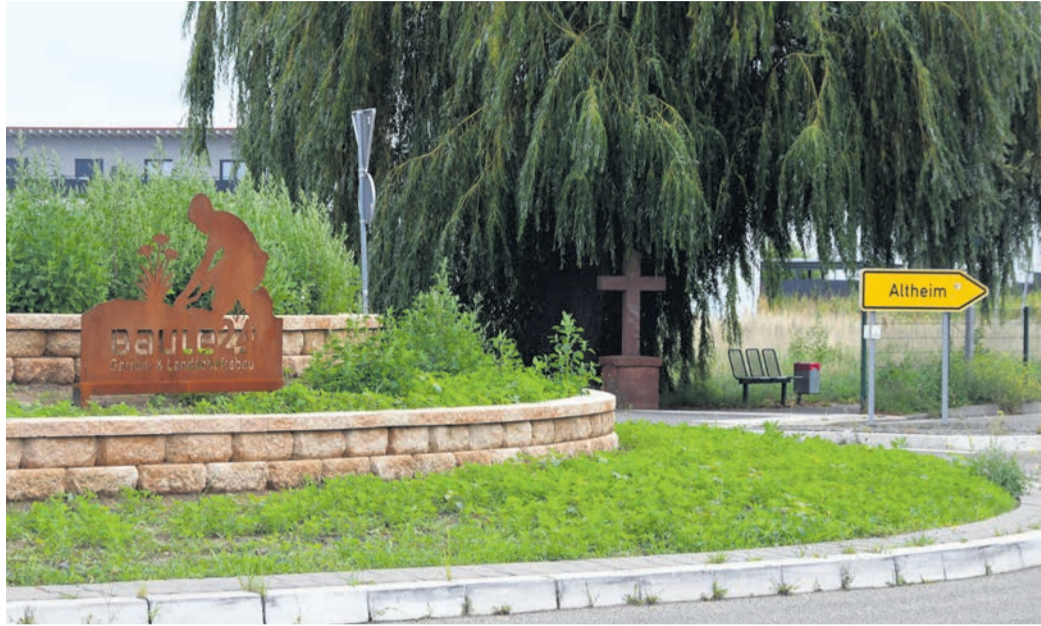
Die Umgestaltung des Seerich-Kreisels (vorn) ist in vollem Gange. Das Grundstück am Feldkreuz (hinten r.) ist an einen neuen Investor verkauft worden. Weiterhin sollen dort aber ein Lebensmittel-Markt mit Wohnungen obendrauf entstehen.

Ursprünglich sollte das Objekt im Winter 2022 fertig werden, später verschob Schoofs den Termin auf Herbst 2024. Im Februar 2024 dann der Rück-