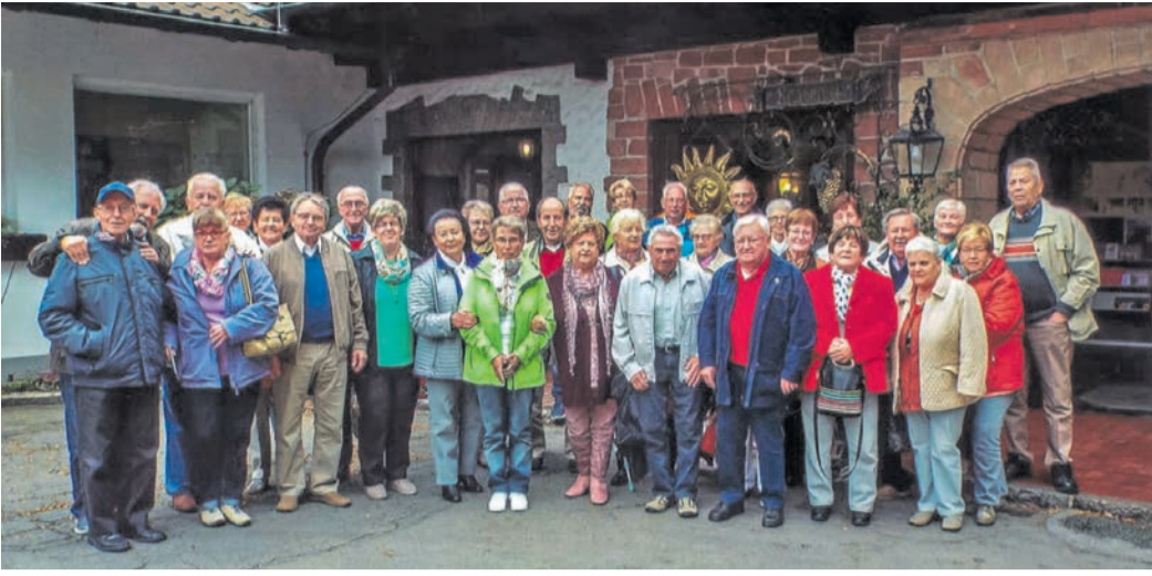
Ein Bild aus vergangenen Tagen: Die MGV-Senioren bei ihrem Ausflug 2016 in den Odenwald.