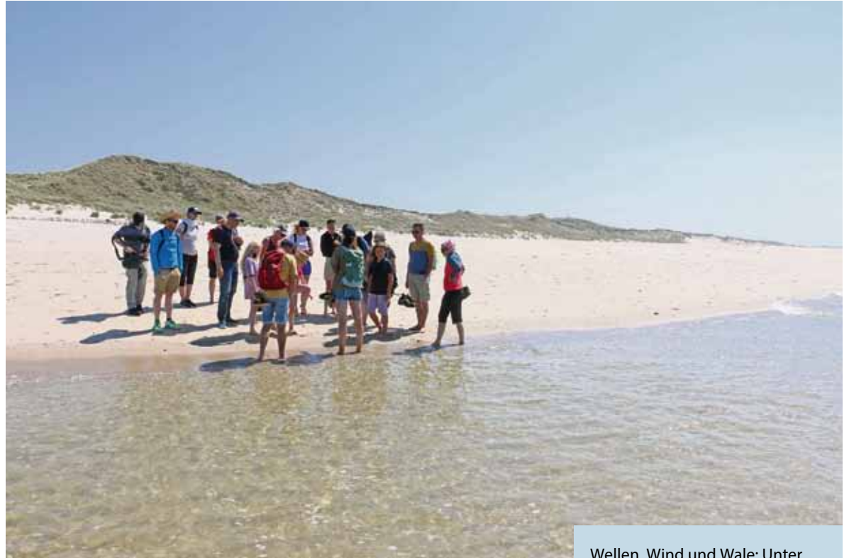
Wellen, Wind und Wale: Unter diesem Motto führt eine Tour entlang der Sylter Westseite zum Leuchtturm List-West.

Der Name ist Programm: „Wellen, Wind und Wale“ lautet der Titel einer geführten Tour, die das Team des Erlebniszentrums Naturgewalten Sylt anbietet. Die Strecke führt entlang der Sylter Westseite Richtung Ellenbogen zum Leuchtturm List-West. Menschenleere Strände, rastende Vögel und frei laufende Schafe prägen das Landschaftsbild hier ganz im Norden der Insel. Mit Glück begleiten Schweinswale die Tour entlang der Wasserkante. Insbesondere bei ruhiger See stehen die Chancen sehr gut, die Meeressäuger oft nur wenige Me-