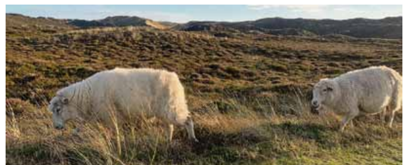
Die besondere Heidelandschaft in List auf Sylt können Urlauber sowohl individuell als auch bei geführten Touren kennenlernen.

Matschwelt vorkommen – doch das Watt steckt voller Leben. Gerade für Kinder ist die Begegnung mit Wattwurm, Krebs und Co. ein besonderes Erlebnis. Nicht nur für Feinschmecker ist die Austerntour empfehlenswert. Seit 1986 wird die ursprünglich aus Japan stammende Pazifische Felsenauster vor List auf Sylt großgezogen. Bei einer dreistündigen Führung kommen Besucher der „Sylter Royal“ und ihrer Kinderstube ganz nah.