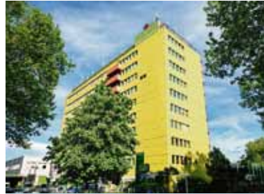
Asklepios Paulinen Klinik Wiesbaden.

Auszeichnung mit Substanz Die Bewertung beruht auf einer umfassenden Datenanalyse, die Qualitätsberichte, Patientenmeinungen, Hygienestandards und Serviceleistungen berücksichtigt. Über 2300 Krankenhausstandorte wurden