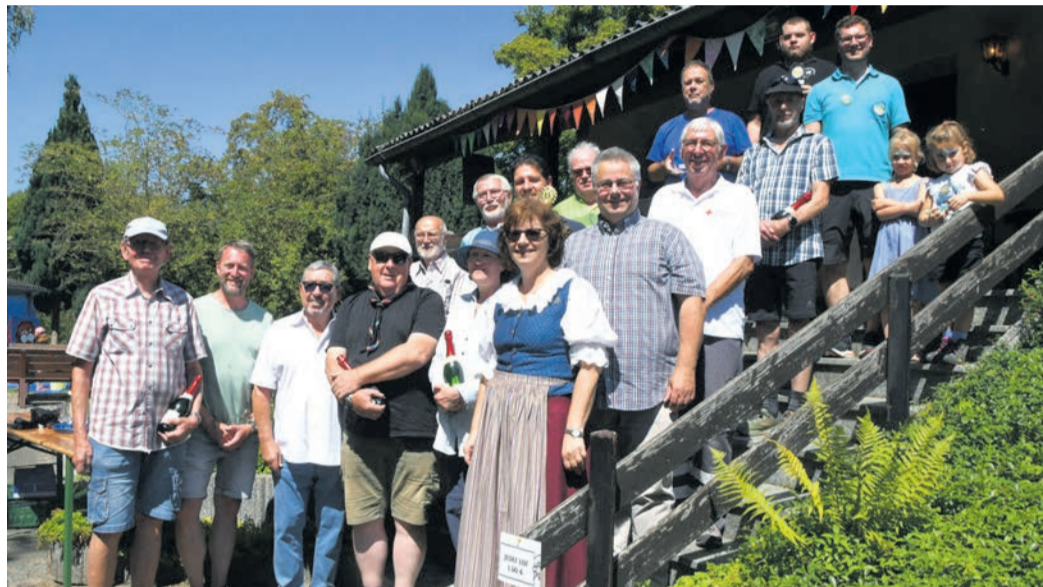
Vertreter jener Gruppen, die eine zweistellige Zahl an Wanderungen erreichten, posieren am Sonntagnachmittag nach der Siegerehrung am Wanderheim.