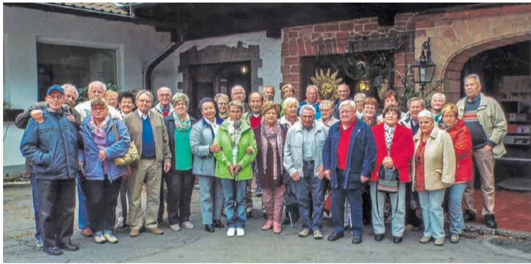
Ein Bild aus vergangenen Tagen: Die MGV-Senioren bei ihrem Ausflug 2016 in den Odenwald.