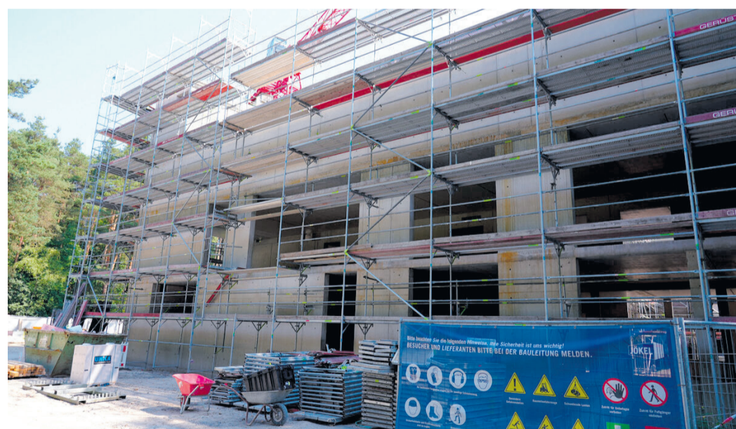
Hinter den Gerüsten ist der fertige Rohbau des zweigeschossigen Neubaus zu erkennen.

Die Gesamtinvestition beträgt rund 15,6 Millionen Euro. Davon entfallen knapp 10,2 Millionen Euro auf den Kreis Offenbach. Die Stadt Obertshausen übernimmt gemäß der Ein-Drittel-zwei-Drittel-Regelung zwei Drittel der Kosten für die Betreuungsräume, insgesamt rund 5,37 Millionen Euro. Im dritten Quartal 2026 soll das neue Gebäude in Betrieb genommen werden. In der Zwischenzeit sorgt eine Containeranlage für die Deckung des aktuellen Raumbedarfs. Nach Abschluss der Arbeiten erfolgen noch der Abriss des bisherigen Betreuungsgebäudes und die Neugestaltung der Freianlagen. Die Fertigstellung aller Maßnahmen ist bis Anfang 2027 vorgesehen.