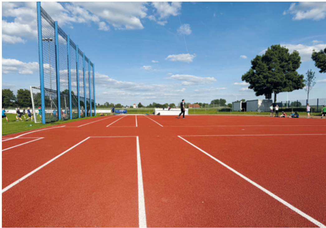
Tartanfläche auf dem Sportplatz Wixhausen.

Wixhausen (ist). Wir freuen uns am Samstag, den 20. September, auf die offenen Leichtathletik Vereinsmeisterschaften im Stadion der TSG Wixhausen.