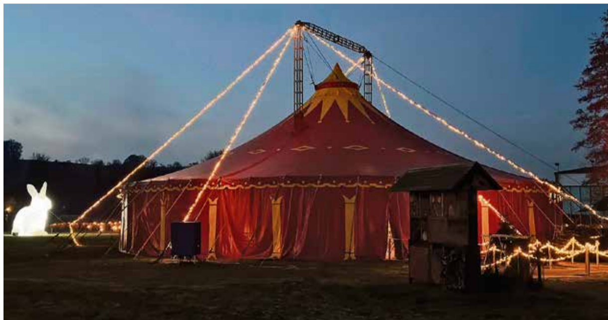
Das Weihnachtsmarktzelt ist in diesem Jahr deutlich größer.