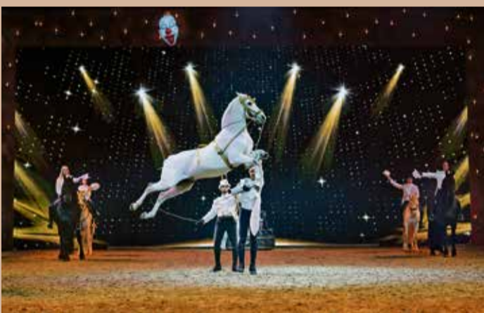
Kapriole der Equipe Valenca.