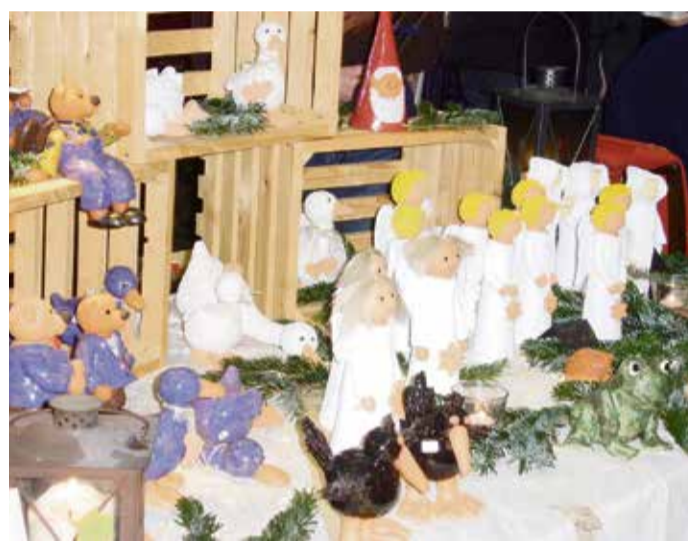
Hobby-Künstler stellen ihre Werke zum Weihnachtsmarkt aus.