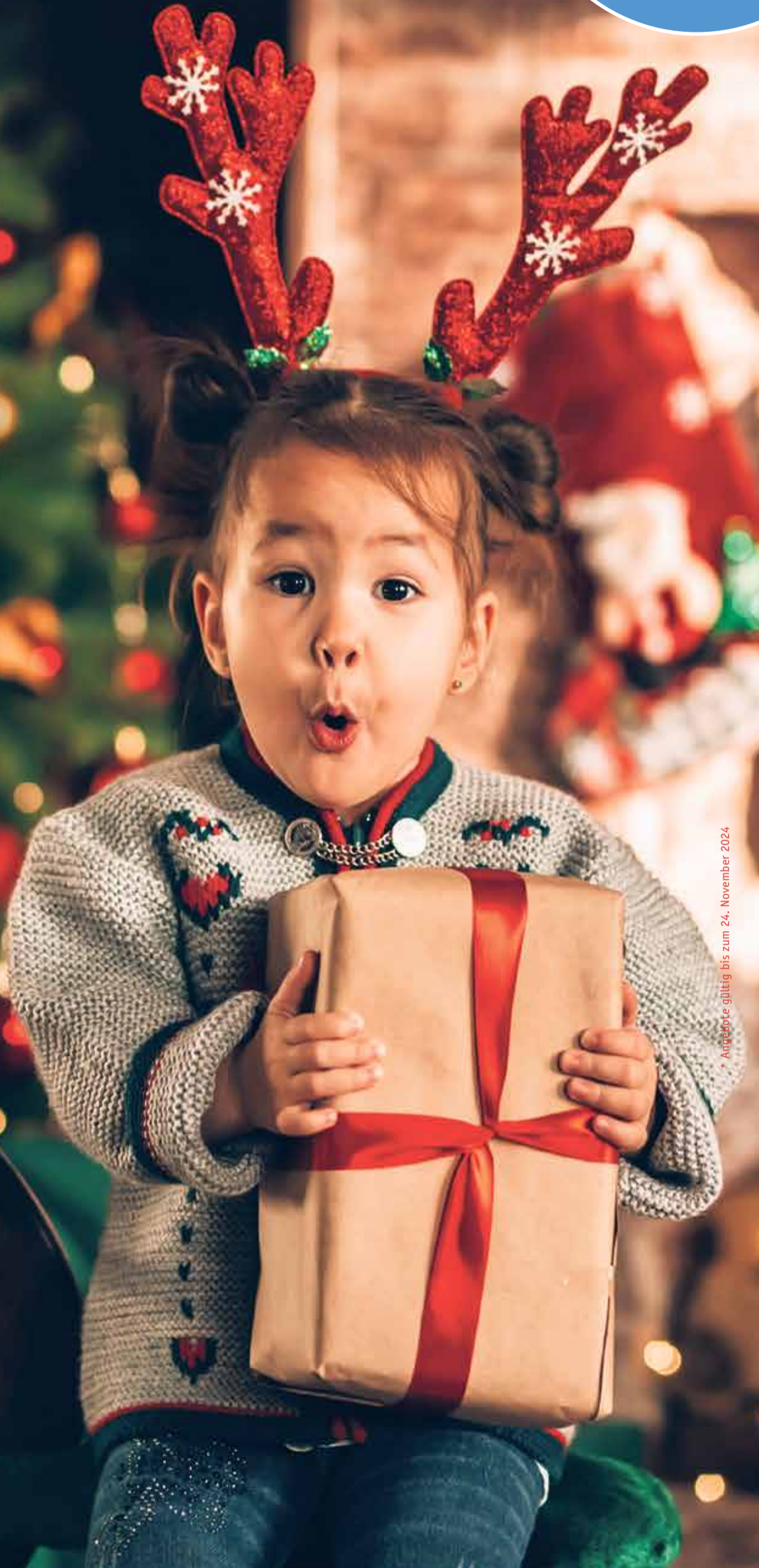
Angeworbene gültig bis zum 24. November 2024

Kommen Sie vorbei und lassen Sie sich verzaubern – wir freuen uns auf Ihren Besuch!