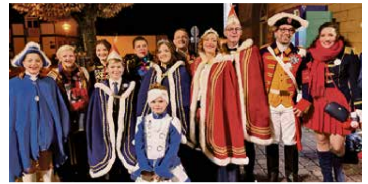
CVUlK-Prinzenpaare und Gefolge.