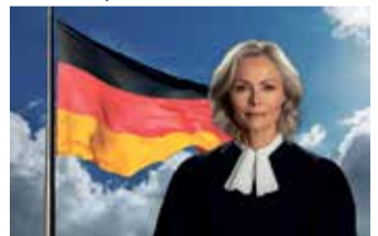
Es geht um viel Geld

braucherportal www.helpcheck.de gratis und unverbindlich für Sie. Die Prüfung erfolgt auf Basis hunderter Urteile datenbankgestützt und individuell durch spezialisierte Anwälte. Sie werden nach Vertragsprüfung beraten und können das Unternehmen, sofern Sie wünschen, auf Erfolgsbasis mit der Durchsetzung Ihres Anspruchs beauftragen. Das bedeutet für Sie: Sie können nur gewinnen, denn Sie bezahlen nur einen Anteil des für Sie bei Ihrer Versicherung erzielten Mehrwertes an das Verbraucherportal. Ein fairer Deal, denn das Geld, das Sie ohnehin von der Versicherung erhalten hätten, bleibt komplett unangetastet. Das Unternehmen hat bereits über 50 Millionen Euro an seine Kunden ausbezahlt. Die gratis Vertragsprüfung finden Sie hier: www.helpcheck.de/geldretten