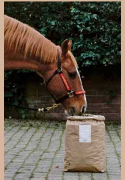
„Für Weltmeister nur das Beste: Alfa Cubes plus“.

Oh je – noch ein weiteres Produkt, mag so mancher denken in Anbetracht der vielen Heucobs, Luzerne Pellets oder Würfel, die bereits auf dem Markt sind. Ja, wir haben vieles davon durch. Wir betreiben seit über 35 Jahren ein Ausbildungs- und Zuchtbetrieb für Westerntiere und kamen – in Schleifen – immer wieder auf die Luzernefütterung zurück. Der hohe Eiweißgehalt mit gutem Aminosäuremuster in Kombination mit der Verlängerung der Freßzeiten und vermehrter Speichelbildung durch die Steigerung der Rohfaseranteils macht Luzerne zu einem idealen Pferdefutter für Zuchttiere, Sportpferde und „Rentner“ – also alle Pferde mit erhöhtem Eiweißbedarf. Dann kamen die vielen „Abers“: Luzernepellets, die aus Luzernegrünmehl hergestellt werden (fällt bei der Trocknung der Luzerne an, da die Blätter schneller trocknen als die Stängel und als „Staub“ herausrieseln), bringt nichts, um die Freßzeiten und die Kautätigkeit zu verlängern. Also kamen wir auf Würfel oder Cubes.