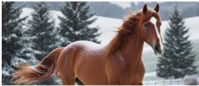
Auf dem Rücken der Pferde: Pferdereion Odenwald Seiten 8-9

Odenwaldkreis: Dramatische Haushaltslage zwingt zum Handeln Seite 4 Kampagne 24/25 eröffnet: Fastnachter feiern in Michelstadt, Erbach, Höchst Seiten 10 & 15