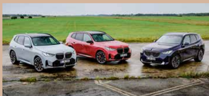
Der SAV BMW X3, ein Familienbild.

Alltag, Reisen und Freizeit in einem Auto