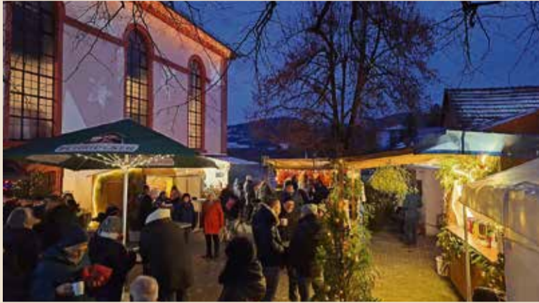
Die Lichterweihnacht im vollen Glanz.

Eine große Anzahl von Ständen präsentieren sich vor der Kirche bis zum Marktplatz mit ihren Angeboten. Die Freiwillige Feuerwehr Reichelsheim bietet Glühwein mit und ohne