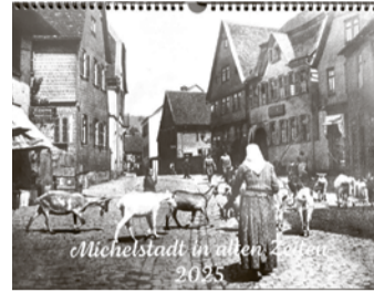
Die Große Gasse – im Hintergrund ist das Gasthaus „Zum Grünen Baum“.

Kalender ist in zwei Größen in der Gästeinformation Michelstadt und in der Buchhandlung Schindelhauer in der Bahnhofstraße erhältlich. Der kleine im DIN A4 Format kostet zehn Euro, der größere in DIN A3 kostet 17 Euro. red