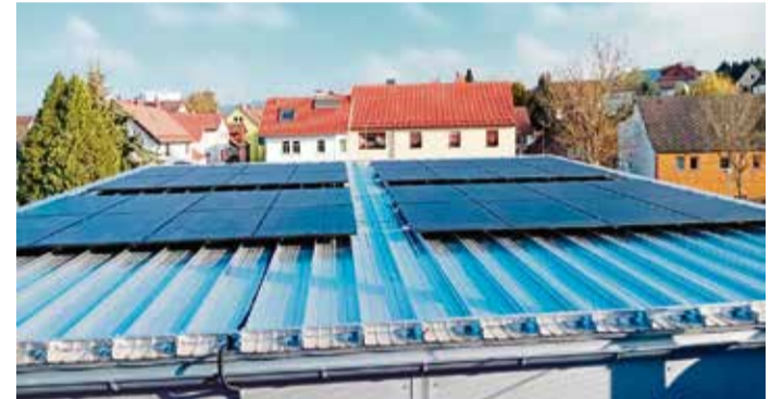
Die Photovoltaikanlage auf dem Dach.

Michelstadt. Die Freiwillige Feuerwehr Michelstadt-Stockheim hat jetzt nicht nur mehr Platz in der fertiggestellten Fahrzeughalle, sondern auch eine Photovoltaikanlage mit 14kWp Leistung auf dem Dach. Der produzierte Strom wird, wenn er nicht direkt genutzt oder ins Stromnetz eingespeist wird, auf einen Batteriespeicher von 11 kW geladen. Die Kosten der neuen Anlage liegen bei 16.000 Euro.