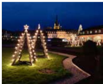
Weihnachtlich wird es in Erbach.

„Weihnachtliches Handwerk“ Freitags um 16 Uhr (Termine: 29. November, 6. Dezember, 13. Dezember, 20. Dezember) haben Besucher die Möglichkeit, im Rahmen der Führung „Weihnachtliches Handwerk“ die Traditionen der Odenwälder Handwerkskunst zu erleben. Die Führung geht durch