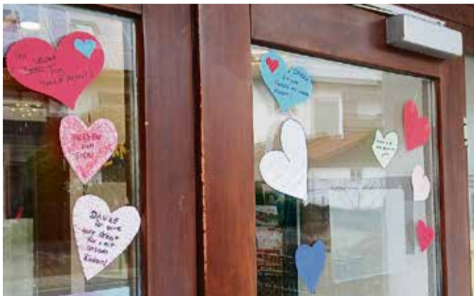
Die bunten Herzen an der Tür.

Die bunten Herzen sollen noch lange als Symbol der Dankbarkeit an der Eingangstür hängen. red