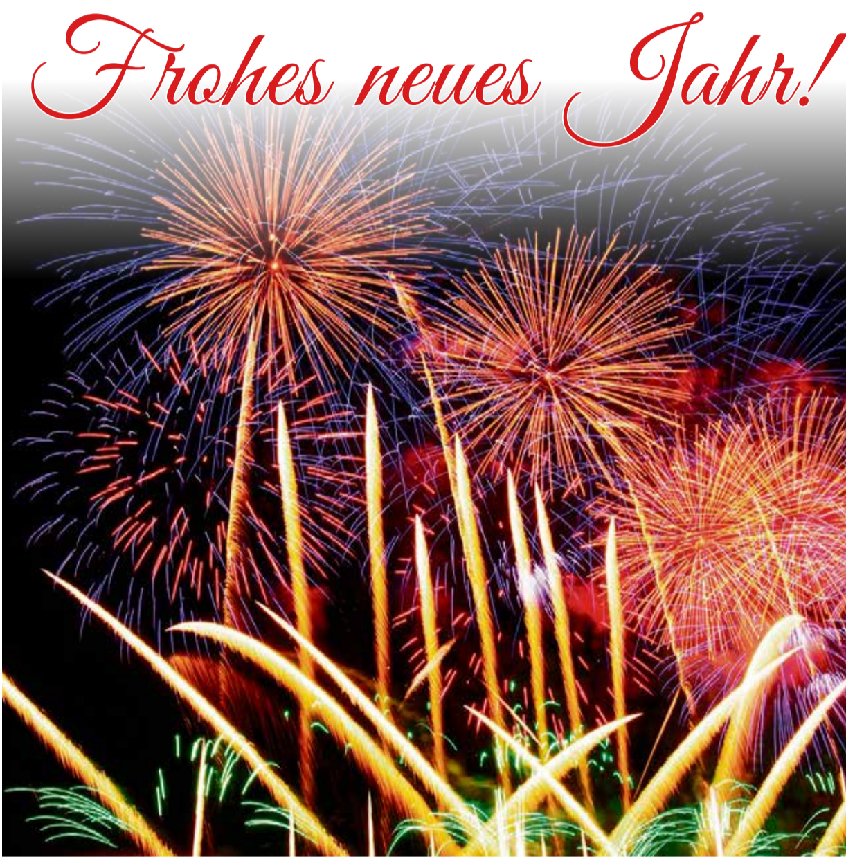
Farbenfroh und knallig – so soll Silvester gefeiert werden.

Lautertal. Am Mittwoch, 18. Dezember, kam es gegen 19 Uhr auf der L3098 zwischen Beedenkirchen und Reichenbach zu einem Verkehrsunfall, bei dem ein 45-jähriger Radfahrer aus Darmstadt schwer verletzt wurde. Zum Unfallhergang wird noch ermittelt, laut Polizei sei der Radfahrer wahrscheinlich mit einem Wildtier zusammengestoßen. Ein Gutachter wurde hinzugezogen. Der von Verkehrsteilnehmern auf der Fahrbahn gefundene Radfahrer wurde lebensbedrohlich verletzt. Die Straße musste mehrere Stunden voll gesperrt werden. Hinweise an Tel.: 06251-84680.