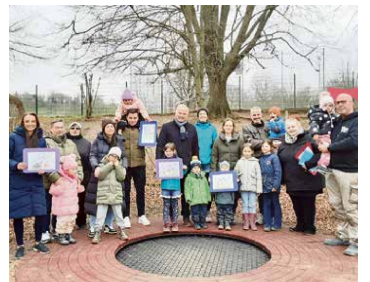
Das neue Bodentrampolin, ein Weihnachtsgeschenk für die Kinder der Kinderinsel.

Die Kinder haben damit die Möglichkeit im Außenbereich der Kita ein weiteres Angebot zum Toben zu nutzen. red