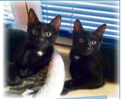
Mac & Marlon

ARTGERECHT TIERSCHUTZ E. V. (PM). Mac und Marlon (Europäisch Kurzhaar, männlich, geboren Ende April 2025, Freigänger) sind zwei zutrauliche und liebenswürdige Katerbrüder, die gemeinsam auf der Suche nach einem neuen Zuhause sind. Ihr glänzendes, schwarzes Fell wird von weißen Brustflecken geziert, und in der Sonne schimmert sogar ein feines Tigermuster durch – ein echter Hingucker! Die beiden sind auf ihrer Pflegestelle bestens sozialisiert, kennen andere Katzen und auch Hunde und zeigen sich dort sehr verspielt, neugierig und verschmust. Sie lassen sich sogar rufen und kommen zuverlässig, wenn sie ihren Namen hören. Sie lieben es, gemeinsam zu klettern, zu spielen, sich zu verstecken und anschließend zusammen im Körbchen zu entspannen. Das Katzenklo benutzen sie zuverlässig, und Krankheiten sind bislang nicht bekannt. Mac und Marlon wünschen sich ein Zuhause, in dem sie – idealerweise in einem verkehrsberu-