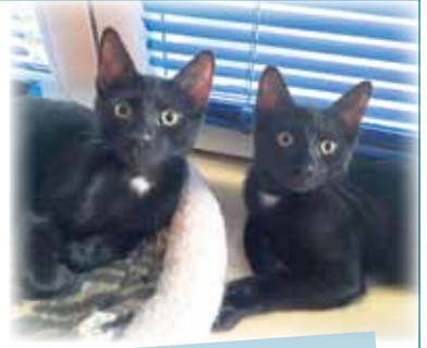
Mac & Marlon

ARTGERECHT TIERSCHUTZ E. V. (PM). Mac und Marlon (Europäisch Kurzhaar, männlich, geboren Ende April 2025, Freigänger) sind zwei zutrauliche und liebenswürdige Katerbrüder, die gemeinsam auf der Suche nach einem neuen Zuhause sind. Ihr glänzendes, schwarzes Fell wird von weißen Brustflecken geziert, und in der Sonne schimmert sogar ein feines Tigermuster durch – ein echter Hingucker! Die beiden sind auf ihrer Pflegestelle bestens sozialisiert, kennen andere Katzen und auch Hunde und zeigen sich dort sehr verspielt, neugierig und verschmust. Sie lassen sich sogar rufen und kommen zuverlässig, wenn sie ihren Namen hören. Sie lieben es, gemeinsam zu klettern, zu spielen, sich zu verstecken und anschließend zusammen im Körbchen zu entspannen. Das Katzenklo benutzen sie zuverlässig, und Krankheiten sind bislang nicht bekannt. Mac und Marlon wünschen sich ein Zuhause, in dem sie – idealerweise in einem verkehrsberu-