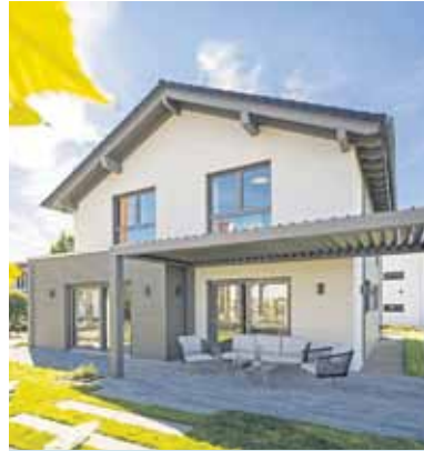
Bis das neue Zuhause steht, sind viele Hürden zu meistern. Ein seriöser und finanzieller solider Baupartner ist dabei eine wichtige Stütze.

(DJD-K). Ein eigenes Zuhause bauen – für viele Menschen ist dies der größte Traum. Damit sich die Wunschvorstellungen in der Realität erfüllen, kommt es auf eine solide Planung und die richtigen, verlässlichen Partner an. Das beginnt mit der Finanzierung: Eine gute Eigenkapitalbasis von etwa einem Viertel bis einem Drittel der Gesamtkosten erleichtert diesen Schritt, zudem sollte man beim finanziellen Aufwand auch Baukosten wie Notargebühren und Grunderwerbssteuer nicht vergessen. Sie können bis zu 15 Prozent der Gesamtkosten ausmachen.