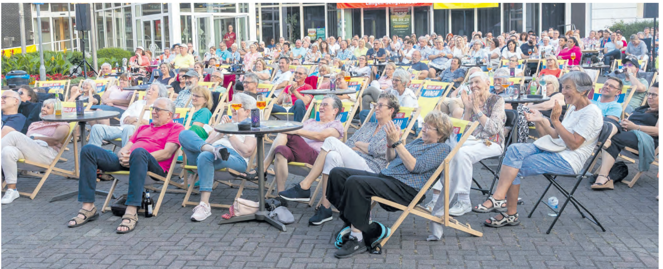
Unter anderem in Liegestühlen genossen die Zuschauer die Show am Bürgerhaus.

Unabhängige Wochenzeitung und Nachrichten aus und für Obertshausen