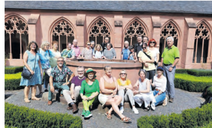
Mit dem Bus auf Chorfahrt nach Mainz

So ging es mit dem Bus über die Landesgrenze nach Mainz. Dort angekommen, startete man gleich mit einer informativen Stadtführung. Es konnte kein Zufall sein, in Person der Stadtführerin auf eine Fastnachtlerin zu treffen und damit war das Motto für den Tag gefunden: Mainz bleibt Mainz, wie es singt und lacht. Es wurde natürlich gesungen, aber auch viel gelacht. Doch zu Beginn hatte das Tagesprogramm für die Sängerinnen und Sänger Einblicke in die Stadtgeschichte vorgesehen. Quer durch die Altstadt bei bestem Ausflugswetter ging es zum Dom, der mit seiner über 1000-jährigen Geschichte Zeuge unterschied-