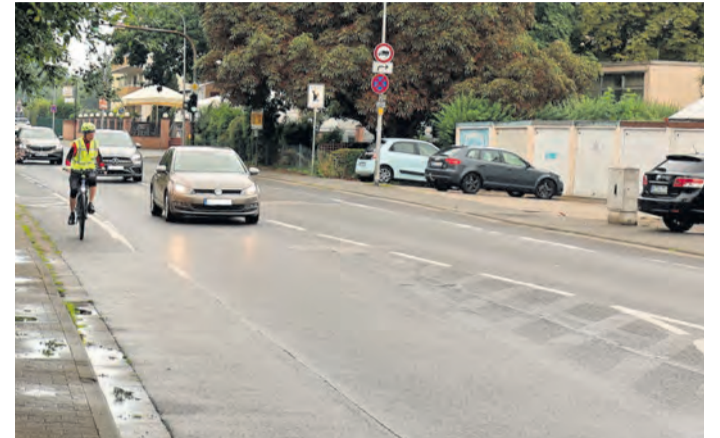
„Jetzt endet der Fahrradstreifen und die Fahrbahn schwenkt nach innen rein. Das Fahrrad müsste sich jetzt eigentlich in Luft auflösen“, beschreibt Christian Beers die Situation vor der Kreuzung am Badehaus.

Radsituation in Rödermark. Vorstandsmitglied Winfried Fischer lobt, dass in der jüngeren Vergangenheit mehrere Einbahnstraßen im Stadtgebiet für Radfahrer auch in der Gegenrichtung geöffnet wurden. Eine kleine Verbesserung sei zudem, dass die Drängelgitter auf den Wegen vielerorts verbreitert wurden, so dass nun auch Lastenräder besser durchpassen. Positiv erwähnen die ADFC-Leute auch den neuen Übergang für Radler und Fußgänger auf der Kreisquerverbindung am verlängerten Eulerweg in Waldacker. Im Fahrradklima-Test hatte Rödermark in den Rubriken „Fahrradmitnahme in öffentlichen Verkehrsmitteln“ und „Radfahren für Alt und Jung“ seine Stärken. Winfried Fischer bietet als ADFC-Tourenguide für Interessierte viele Radtouren an. „Da