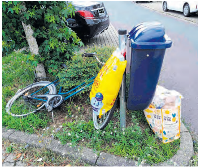
Unappetitliche Hinterlassenschaften der Kategorie Haus- und Sperrmüll, die in die öffentlichen Abfallbehälter in Rödermark gestopft und manchmal auch daneben abgestellt werden, sorgen beim KBR-Personal für Ärger und zusätzlichen Arbeitsaufwand.

Doch manchmal gibt es beim großen Reinemachen auch Begegnungen der unschönen Art, so wie neulich am Messenhäuser Ortseingang in Höhe des Kapellchens. „Ich habe einen Herrn höflich darauf hingewiesen, dass er doch bitte sein Hausmüll-Säckchen, das er ganz offenkundig dabei hatte, nicht in einen der öffentlichen Abfallkörbe werfen sollte – denn die sind dafür nicht bestimmt. Mit dem Kommentar ‚Ich bezahl‘ doch genug Grundsteuer‘ hat er die Straßenseite gewechselt und dort seinen Beutel in einem der blauen Plastikbehälter entsorgt. So viel Dreistigkeit – da war ich