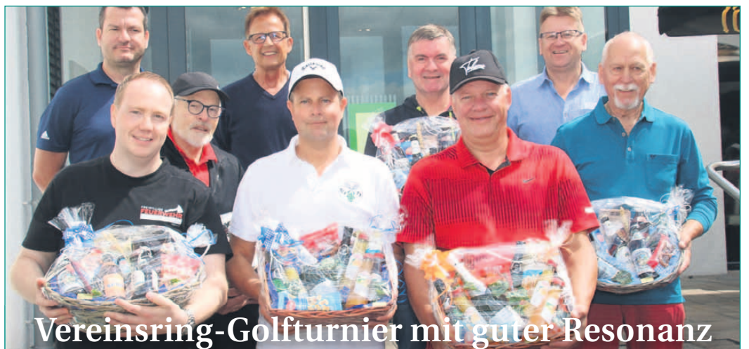
Vereinsring-Golfturnier mit guter Resonanz

Gemeinschaft.“ Der Kunstrasenplatz dient als Trainings- und Begegnungsstätte für mehrere örtliche Vereine, darunter die Sportfreunde Seligenstadt, die Sportvereinigung Seligenstadt, die TuS Froschhausen und die JfV Seligenstadt-Zellhausen-Klein-Welzheim. Besonders in der nassen Jahreszeit und im Winterhalbjahr bietet er optimale Spielbedingungen. Die Modernisierung des in die Jahre gekommenen Platzes begann Ende Mai und wurde nun abgeschlossen. Die Investitionskosten von rund 300.000 Euro wurden durch das Landesprogramm Sportland Hessen gefördert.