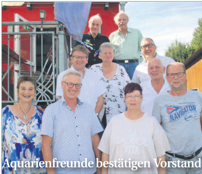
Aquarierfreunde bestätigen Vorstand