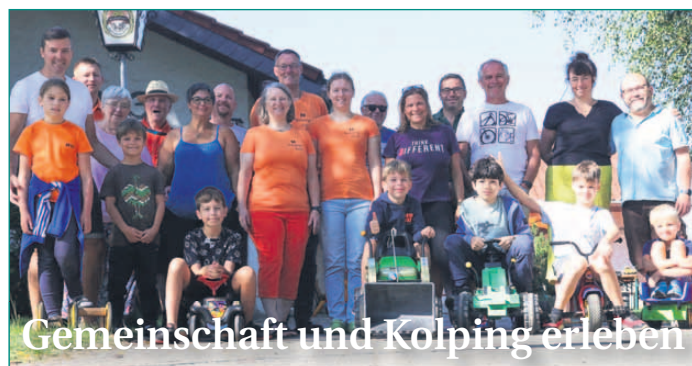
Gemeinschaft und Kolping erleben

öffnung. „Unser Ziel ist es, nicht nur Spaß zu vermitteln, sondern auch den sozialen Zusammenhalt zu stärken und den Kindern Raum für gemeinsame Erlebnisse zu bieten. Ich bedanke mich bei meinem Team für die Organisation und wünsche allen Kindern eine magische Zeit, die lange in Erinnerung bleibt!“