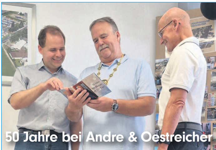
50 Jahre bei Andre & Oestreicher

Das Glaabsbräu Festbier wird, wie alle Glaabsbräu Biere, nach eigener Rezeptur und mit naturbelassenem Aromahopfen gebraut – ganz ohne Zusatzstoffe, Farbbier oder chemische Hilfsmittel. Der Geschmack entsteht ausschließlich durch beste, regionale Rohstoffe, Zeit und echtes Brauhandwerk. Gebraut wird CO -neutral und trinkwassersparend – für ein Bier, das nicht nur schmeckt, sondern auch nachhaltig überzeugt.