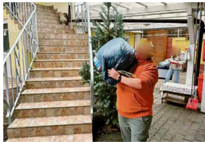
Die Ankunft der Spende im Frauenhaus in Rumänien. Zum Schutz der Frauen wurde das Bild bearbeitet.

GAZ dann nach Rumänien gefahren, wo der Verein ein Frauenhaus betreibt. red