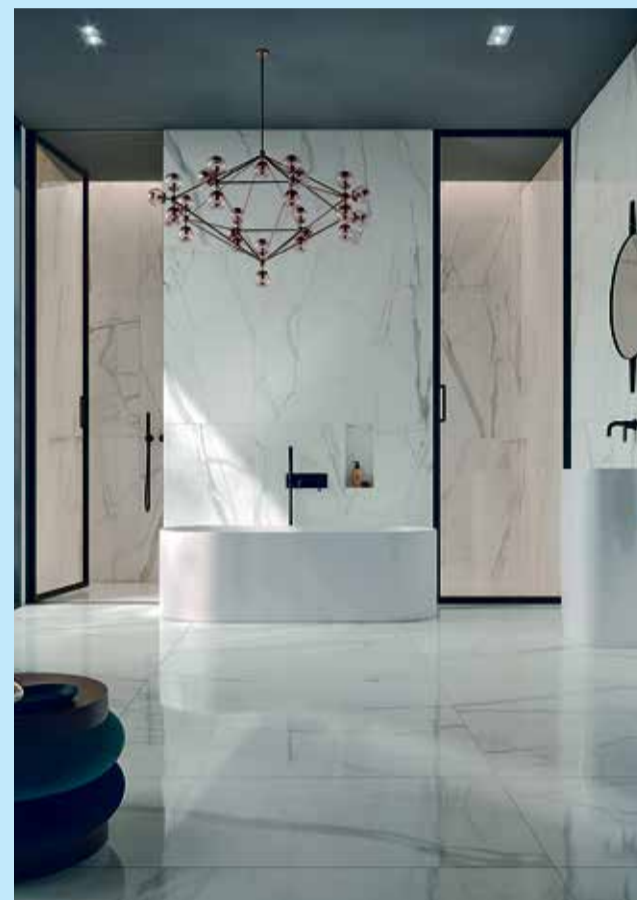
Wenige Fugen auf dem Boden, großes Raumgefühl – XXL-Fliesen liegen im Trend.

kommen.“ Darüber hinaus ist zu beachten, dass sich auch im „fugenlosen Bad“ Wartungsfugen aus Silikon finden, da sie zum Beispiel zwischen Wand- und Bodenflächen unverzichtbar sind. Generell ist die Verlegung groß-formatiger Fliesen anspruchsvoll. Neben einem hohen Planungsaufwand erfordern sie eine detaillierte Abstimmung und Koordination mit anderen Gewerken, wie Verlege-Experte Wolkober betont. Auch gestalterisch achten Profis auf wichtige Details – zum Beispiel, wo Armaturen und Sanitärobjekte platziert werden oder wo Dehnungsfugen verlaufen.