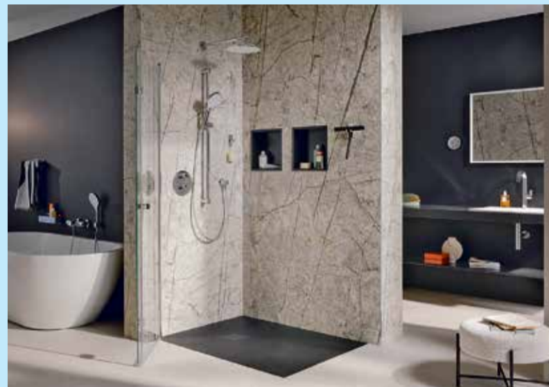
Funktionalität und edle Optik schließen sich nicht aus: Hochwertige Wandverkleidungsplatten sehen nicht nur gut aus, sondern ermöglichen auch eine schnelle Teilsanierung zum barrierearmen Bad.

Für Badezimmer mit begrenztem Platz oder herausfordernden Grundrissen gibt es ebenfalls eine passende Lösung: Duschkabinen mit Schiebetüren oder Walk-In-Lösungen ermöglichen den Umbau von einer Badewanne zu einer großzügigen, begehbaren Dusche auch in kleinen Räumen.