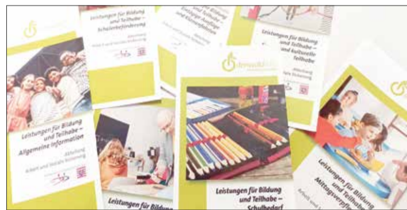
Finanzielle Unterstützung aus dem Bildungs- und Teilhabepaket: Familien mit schulpflichtigen Kindern erhalten Geld für Schulmaterial.

Das ausgezahlte Geld ist eine willkommene Unterstützung für die Familien, wie die Mitarbeiterinnen im Team Bildung und Teilhabe im Kommunalen Service-Center in Erbach, Beate Heckmann und Jennifer Kredel, wissen. Zurzeit erstellen sie die Bescheide für die betreffenden Familien. An insgesamt rund 730 Kindern zwischen sechs und 14 Jahren wird das Geld automatisch ausgezahlt. Hinzu kommen noch leistungsberech-