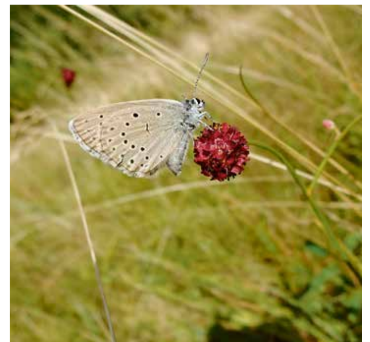
Der Helle Wiesenknopf-Ameisenbläuling

senknopf-Ameisenbläuling nur schwer fortpflanzen können. „Landwirte können jedoch Fördermittel beantragen, wenn sie ihre Wiesen im Sommer FFH-Schutzgebieten Fin-