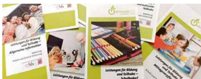
Finanzielle Unterstützung aus dem Bildungs- und Teilhabepaket: Familien mit schulpflichtigen Kindern erhalten im Februar Geld für Schulmaterial.

Anfragen für den Bereich „Kinderzuschlag und Wohngeld“ erfolgen bitte an butwohngeld@odenwaldkreis.de . red