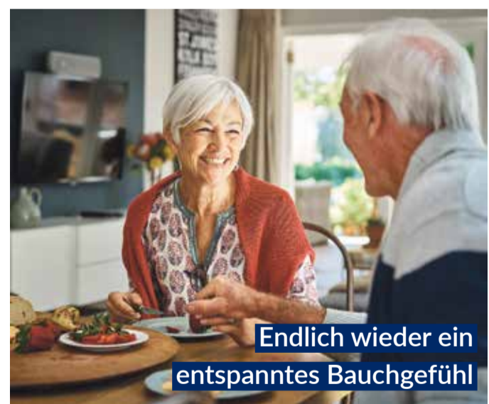
Endlich wieder ein entspanntes Bauchgefühl

Magen-Tropfen, sorgen sechs clever kombinierte natürliche Wirkstoffe für eine deutlich spürbare, schnelle „Erste Magen- und Verdauungshilfe“. Bitterstoffe aus Wermut-, Benediktenkraut und Angelikawurzel steigern rasch die Speichelproduktion und stoßen im Magen-Darm-Trakt die Produktion von Gallensaft und Magensäure an. 1,2 Dank Gänsefingerkraut, Süßholzwurzel sowie Kamillenblüten entspannen Magen und Darm.