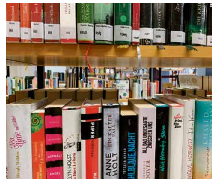
Nur ein kleiner Ausschnitt aus der großen Welt der Literatur.

Stadtbücherei sucht für „Buchtipps des Monats“