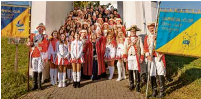
Die Garden des CCH nach der Fahnenweihe.

Höchst. Am Sonntag, 19. Januar, erlebte der Carneval Club blau-gelb in seiner 75-jährigen Geschichte: