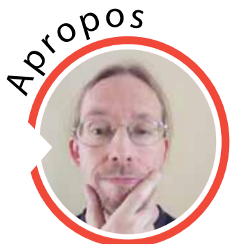
von Sven Iwertowski, Redaktionsleiter