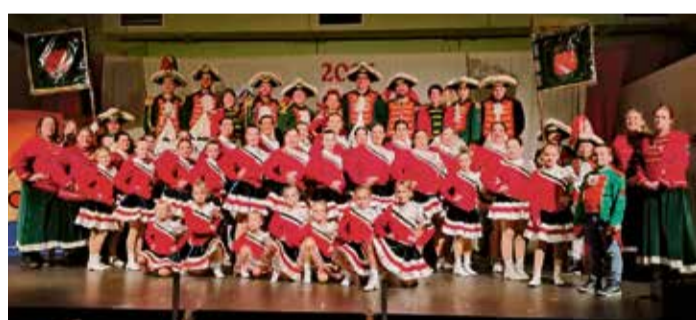
Bunt wurde es auf den Sitzungen.

Erdbachgarde Stockheim startet mit bunten Sitzungen