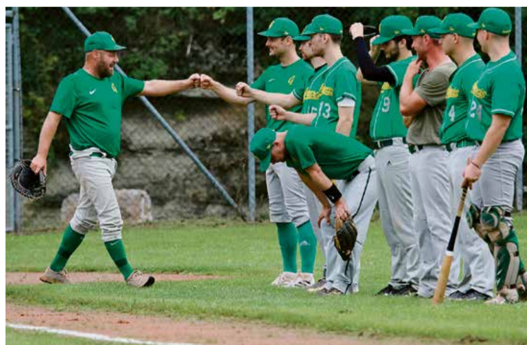
Nach dem Ausstieg im letzten Jahr nehmen die Grasshoppers wieder am Spielbetrieb teil. Nach zehn Jahren erstmals wieder mit einem Jugendteam.

Grasshoppers starten mit Jugendteam in die Saison