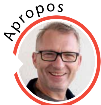
von Volker Zaborowski, Chefredakteur