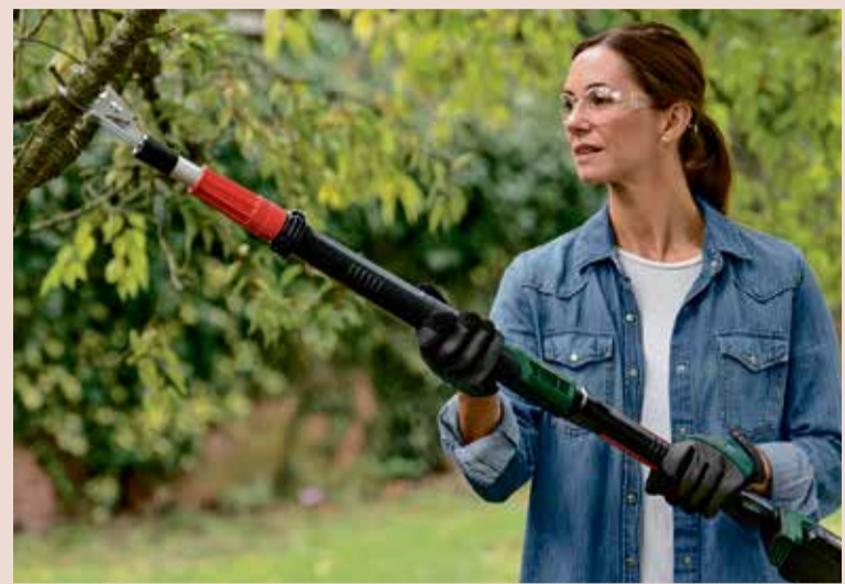
Für dickere Äste von bis zu 45 Millimetern gibt es leistungsstärkere Gartenscheren.

sollten Pflanzen zum Schutz vor Frost im Herbst nicht so stark zurückgeschnitten werden. Bei der Art des Rückschnitts gibt es ebenfalls Unterschiede. Während einigen Pflanzen, wie zum Beispiel Apfelbaum und Zierkirsche, ein Auslichtungsschnitt reicht, sind frühjahrs- und sommerblühende Ziersträucher wie Rosen oder Clematis in der Regel auf einen radikalen Verjüngungsschnitt angewiesen.