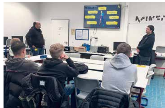
Interessiert hören die Schüler bei der Vorstellung der Berufsfelder zu.

Bei der mittlerweile 17. OBIT handelt es sich um ein gemeinsames Projekt der weiterführenden Schulen im Odenwaldkreis, des Wirtschafts-Service der Odenwald-Regional-Gesellschaft mbH (OREG) und der Industrievereinigung Odenwaldkreis e.V. (IVO).