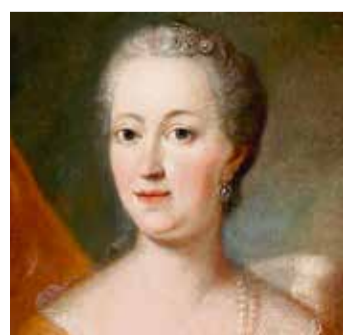
„Women Power“ – Das Kammerkonzert soll übersehene weibliche Komponisten in den Mittelpunkt rücken.