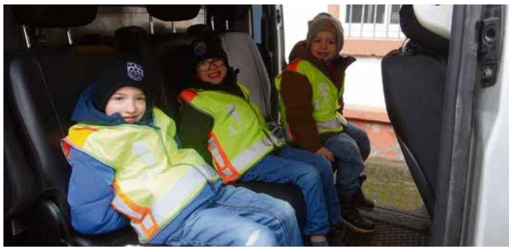
red Ein Highlight war das Innere des Polizeiautos.

Die Kinder durften die Kurzzeitzellen besichtigen, über das Funkgerät sprechen und konnten die schweren Schutzwesten bewundern.