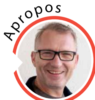
von Volker Zaborowski, Chefredakteur