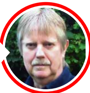
von Dr. Detlef Eichberg