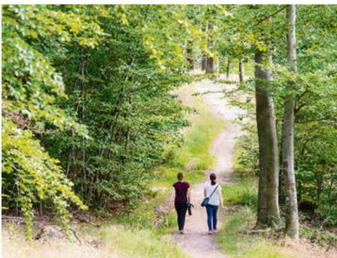
Zur Tagundnachtgleiche können Familien den Frühlingsstart im Wald erleben.

Michelstadt. Ein kindgerechter Spaziergang unter Führung eines Rangers startet am Sonntag, 16. März, durch den Michelstädter Wald. Die Veranstaltung startet um 14 Uhr und ist Auftakt von vier Exkursionen mit Geopark-Rangern, die der Geo-Naturpark in diesem Jahr gemeinsam mit der Stadt Michelstadt anbietet. Treffpunkt ist der Wanderparkplatz am Habermannskreuz Michelstadt. Teilnahme nur mit Anmeldung unter: rangerbuchung@geo-naturpark.de Anmeldeschluss ist Freitag, 14. März, 12 Uhr. Die Teilnahme kostet fünf Euro. red