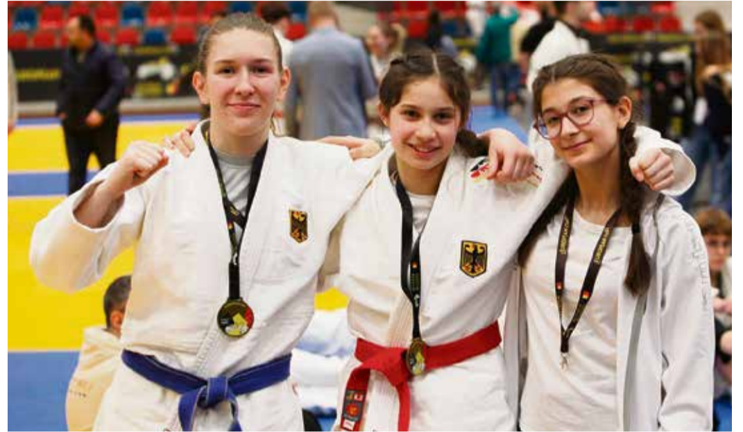
Die drei Kämpferinnen in Beveren, Belgien.

entscheiden. Im Finale stand es bei Oberle 30 Sekunden vor Kampffende 8:8. Oberles Finale endete mit 10:9. Auch sie konnte eine Goldmedaille nach Erbach holen. red