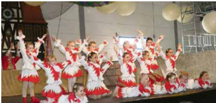
Die Kleinen auf der Bühne ganz groß: Kinderfastnacht in Michelstadt.

Nach der Sitzung legte „DJ Nutella“ (Manuel Minutiello) Fastnachtsmusik auf. red