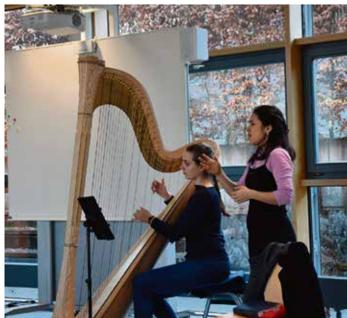
Das Duo Luscinia erzählt den Grundschulern eine musikalische Geschichte.

Das Duo erzählte die Geschichte zweier Schwestern, die die gut gefüllte Schatzhöhle einer Räuberbande fanden und sich dabei den Gefahren der Nacht und der Ungewissheit über die mögliche Rückkehr der Räuber stellen mussten.