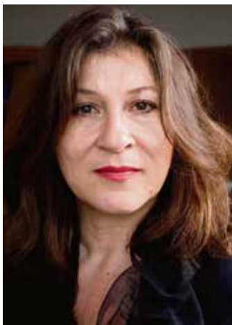
Die Schauspielerin Eva Mattes.

Der Eintritt kostet im Vorverkauf 13 Euro, an der Abendkasse 16 Euro.