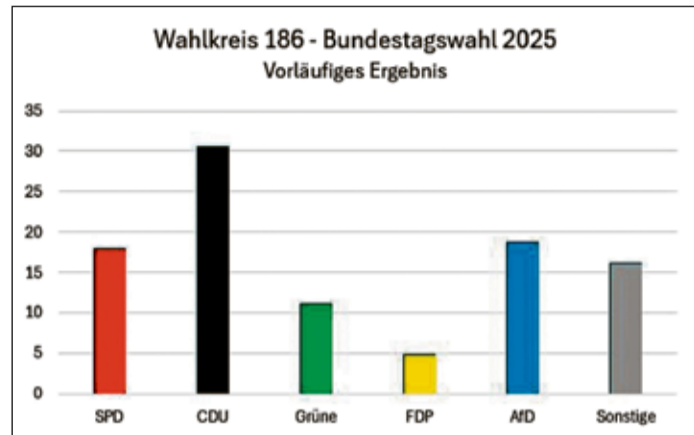
Das vorläufige Wahlergebnis der Bundestagswahl für den Wahlkreis 186.