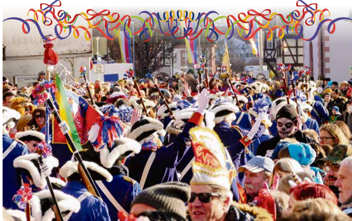
Die Gasse voller Narren und Feierlustiger: Der Umzug des CV Ulk mit dreifachem Helau startet am Fastnachtsdienstag.

Bunt und lustig wird es bei den Fastnachtsumzügen