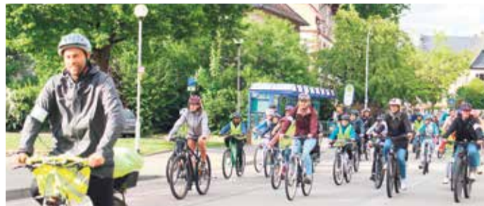
Mit zwei Rädern Kilometer sammeln

Mobil in den Frühling: Neue Modelle und Tipps für die Autopflege Seite 6-8