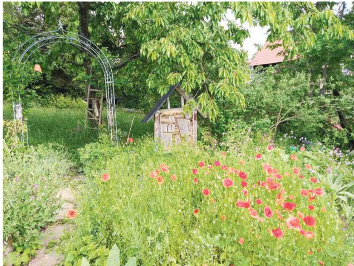
Ein Garten in Brombachtal präsentierte sich im vergangenen Jahr im Rahmen der „Aktion Naturgarten“ den Besuchern.

Gartenliebhaber tauschen sich über Naturgärten aus