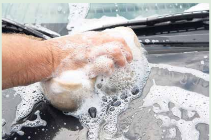
Nicht nur waschen, auch eine technische Kontrolle sind gut für den motorisierten Start in das Frühjahr.

Fazit: Ein gründlicher Frühlingscheck sorgt nicht nur für ein gepflegtes Fahrzeug, sondern auch für mehr Sicherheit und Fahrkomfort. Wer sein Auto rechtzeitig wartet, kann unbeschwert in die warme Jahreszeit starten und vermeidet unangenehme Überraschungen auf der Straße.