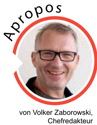
von Volker Zaborowski, Chefredakteur