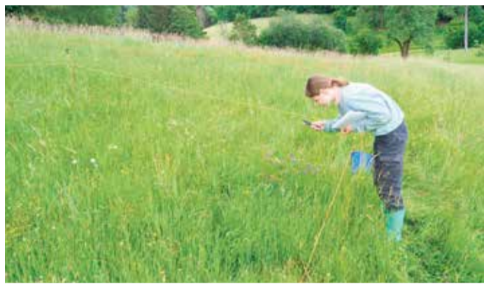
Schaut genau hin: Eine Absolventin des FÖJ im vergangenen Jahr hatte als besonderes Projekt die Bestimmung von Pflanzenarten gewählt. Sie hat dazu mit ihrem Mobiltelefon mehrere Stellen im Odenwaldkreis aufgesucht, das Foto zeigt sie im Naturschutzgebiet Jakobsgrund bei Gammelsbach.

Je nach Interesse kann der Schwerpunkt der Tätigkeiten