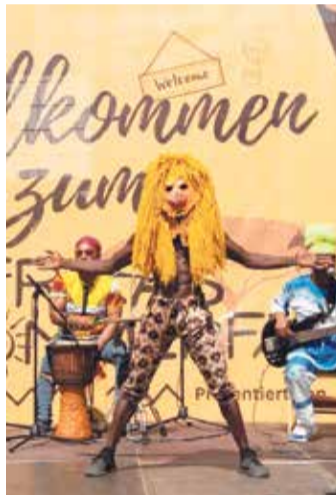
Farbenfroh und kulturell reichhaltig: Eindrücke vom Afrikafest vor zwei Jahren.

Vereins und ermöglicht Vereinsmitgliedern und Gästen, die kenianische Kultur sowie