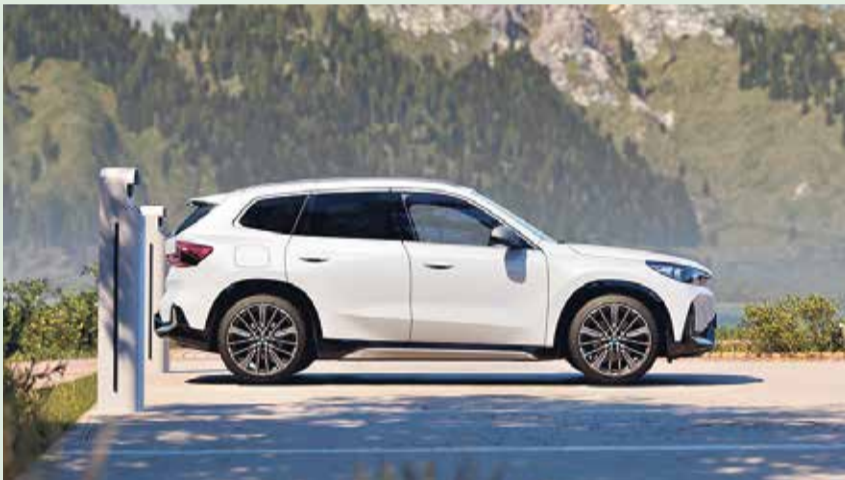
Der neue BMW iX1