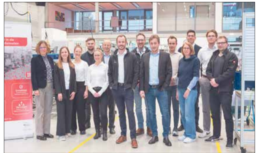
Das MDZ bietet Präsenz- und Online-Formaten an, die je nach Bedarf eingesetzt werden können. Dazu zählen Online-Seminare, Videotelefonate oder Gespräche, um sich persönlich über eine Fragestellung auszutauschen, oder Workshops vor Ort.