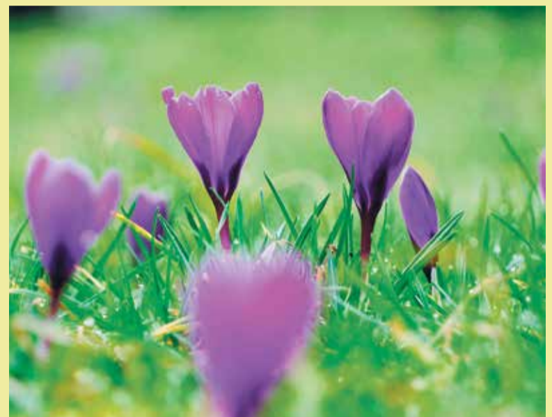
Für eine blühende Oase sorgen Blumen, wenn sie zur richtigen Zeit gepflanzt werden.

noch feuchten Erde und können gut anwachsen. Wer seinen Garten besonders farbenfroh gestalten möchte, kann jetzt Zierpflanzen wie Stiefmütterchen, Vergissmeinnicht oder Primeln pflanzen. Diese sorgen für frühe Farbakzente und sind unkompliziert in der Pflege. Auch Ziergräser und Lavendel lassen sich bereits setzen und verleihen dem Garten Struktur sowie einen angenehmen Duft. Mit diesen ersten Arbeiten wird der Grundstein für eine erfolgreiche Gartensaison gelegt. Wer jetzt aktiv wird, kann sich in den kommenden Monaten über ein blühendes und ertragreiches Gartenparadies freuen.