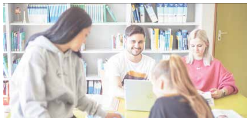
Am Girls' & Boys' Day können Jungen und Mädchen am GZO für einen Tag zum Pflegefachmann bzw. zur Pflegefachfrau werden.

Erbach. Am 3. April ist es wieder soweit: Der bundesweite Girls' & Boys' Day bietet Jugendlichen die Chance, in spannende Berufsfelder hineinzuschneppen. Die Pflegeschulen des Gesundheitszentrums Odenwaldkreis (GZO) laden interessierte Schülerinnen und Schüler der Klassen 5 bis 13 ein, einen Tag lang die vielseitige Welt der Pflege kennenzulernen.