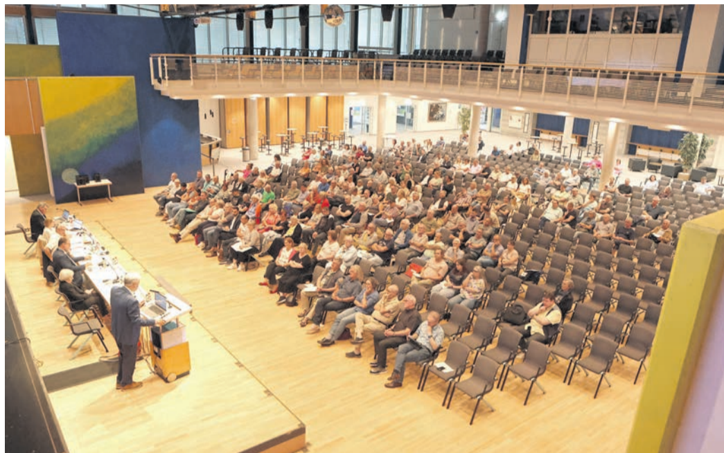
Knapp 200 Rödermärker waren zur Bürgerversammlung in die Kulturhalle gekommen.