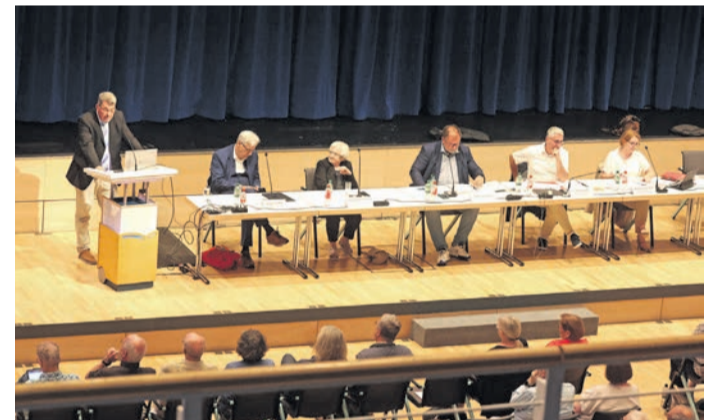
Nach zwei einleitenden Vorträgen wurden die Fragen der Bürger beantwortet.

Mit Blick auf die städtischen Finanzen liefen derzeit schon die Sparrunden für künftige Haushalte, berichtete der Bürgermeister: „Wir versuchen alles Mögliche, aber wir dürfen auch nicht am Ende unsere eigene Stadt kaputt machen und alles, was wir an Errungenschaften haben, zuschließen.“