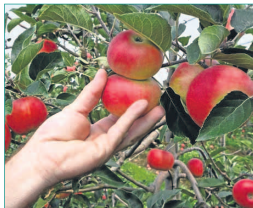
Herbstliche Streuobstwiese – viele Früchte sind reif, doch nicht jeder Baum darf ohne Erlaubnis abgeerntet werden.

sonders betroffenen Gebiet. Dabei ist es gar nicht nötig, verbotenerweise fremde Bäume zu plündern. Digitale Angebote wie die Website www.mundraub.org zeigen auf einer interaktiven Karte, wo sich