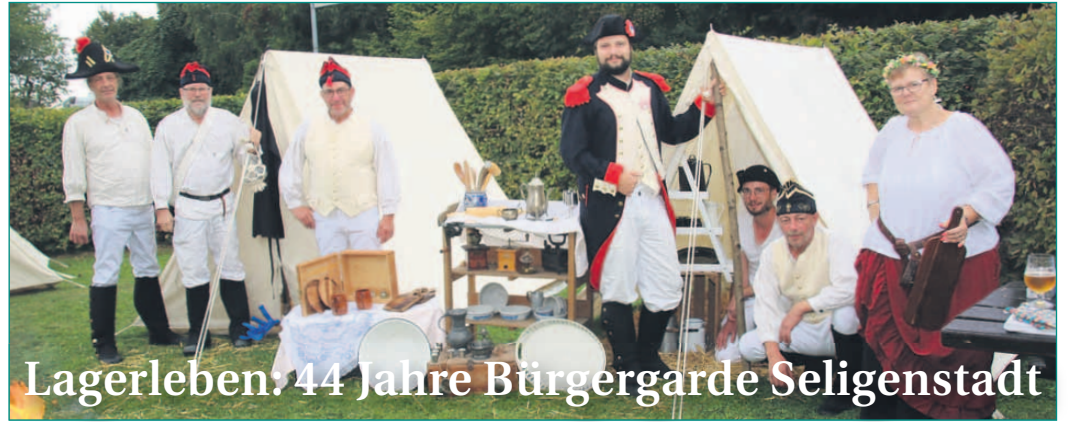
Lagerleben: 44 Jahre Bürgergarde Seligenstadt