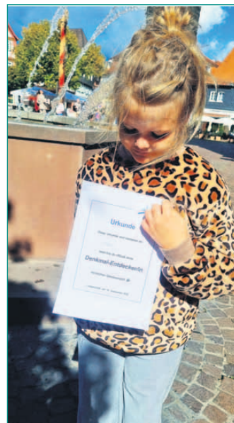
Kleine Denkmalentdeckerin mit Urkunde.

Was am Sonntagmorgen des „Denkmaltag“ noch nach einem verregneten Aktionstag aussah, entwickelte sich ab Mittag zu einem echten Glücksfall: Die Sonne brach durch die Wolken, und bei strahlendem Spätsommerwetter füllten sich Straßen und Plätze der Einhardstadt. Der bundesweite „Tag des offenen Denkmals“ stand in diesem Jahr unter dem Motto „Wert-voll: unbezahlbar oder unersetzlich?“ und lockte zahlreiche Besucherinnen und Besucher an die verschiedenen Stationen. Vom Steinheimer Torturm über die Klostermühle bis hin zum Hans-Memling-Haus zählten die Organisatoren im Laufe des Tages jeweils mehrere Hundert Gäste. „Es war ein schöner Beweis dafür, wie lebendig unsere Denkmale sind und wie groß das Interesse an Geschichte und Kultur hier