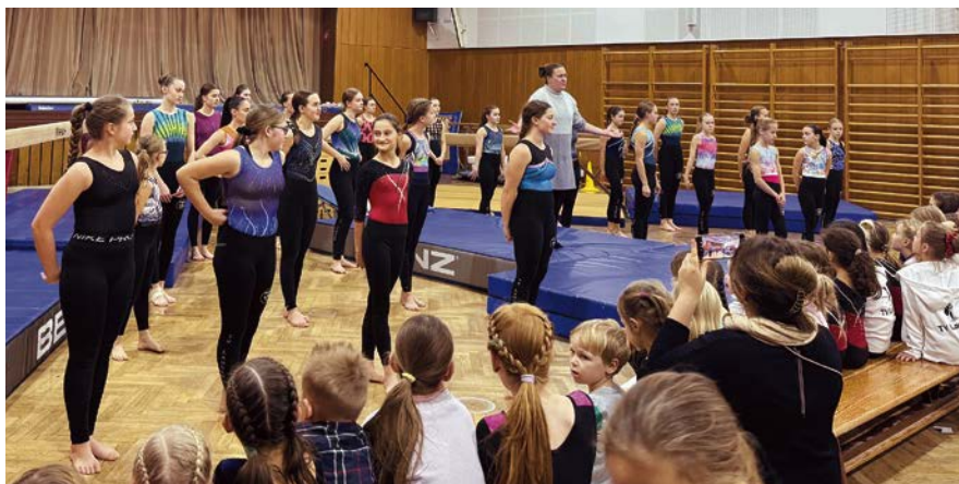
Weihnachtliches Highlight zum Jahresende

Wie in jedem Jahr veranstalteten die Turnerinnen und Turner auch in diesem Jahr Ende Dezember wieder eine gemeinsame Weihnachtsfeier, um das Jahr bei Glühwein, Kinderpunsch, Snacks, Vorführungen und netten Gesprächen Revue passieren und ausklingen zu lassen. Während die Turner eine spektakuläre Trampolinshow lieferten, begeisterten die älteren Turnerinnen die rund 200 Eltern, Großeltern und Verwandten am Schwebebalken. Die Jüngeren zeigten ihr Können an der Turnbank und über den Sprungklotz und Kasten. Auch die Danksagungen an die Trainer und Trainerinnen, sowie die Übungsleiterassistentinnen, den Kassenwart und den Abteilungsleiter durften natürlich nicht fehlen. Im Anschluss an den „offiziellen“ Teil folgte das gemütliche Beisammensein, bei dem allen noch einmal mehr bewusst wurde, welche Dimensionen die Turnfamilie des TVL mittlerweile angenommen hat. Wir wünschen damit allen Mitgliedern, Freund*innen und Unterstützer*innen der Turnabteilung alles Gute für das neue Jahr und wir freuen uns auf ein tolles und erfolgreiches 2025 mit euch allen!