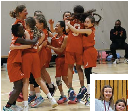
Bild oben links: Siegessfreude der WU12