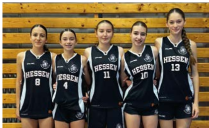
Bild oben rechts: Fünf TVL-Mädchen für das HBV-Jugendteam nominiert