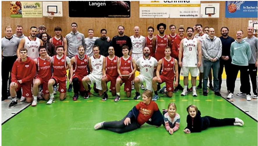
Gruppenfoto nach dem Duell der Herren 3 gegen Herren 4

Trübner. Und die 5. Herren hatten einen guten Start in die Kreisliga B mit Coach Victor Werner.