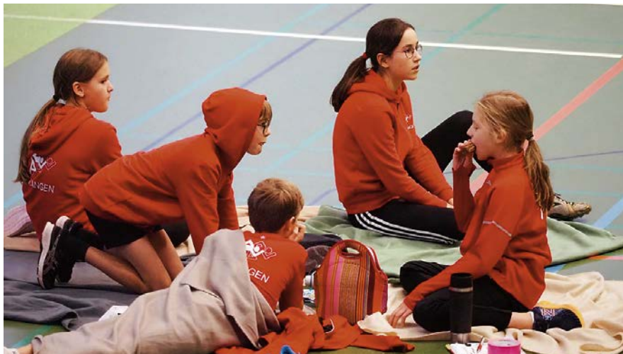
Gruppenpause in der Halle