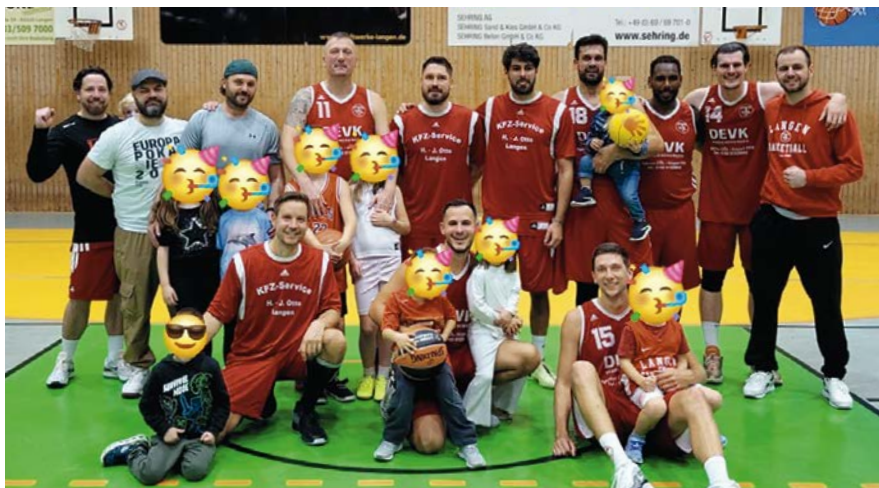
Die Ü35-Herren in dieser Saison wurde Hessen-Meister

Sie setzten ihre Saison nach Gewinn der Bezirks-Meisterschaft im Januar mit dem Hessen-Finale (in Langen) fort. Spiele gegen FTG Frankfurt und TG Rotenburg wurden gewonnen. Und sie qualifizierten sich für die Süd-West-Meisterschaft im April mit folgenden Spielern: