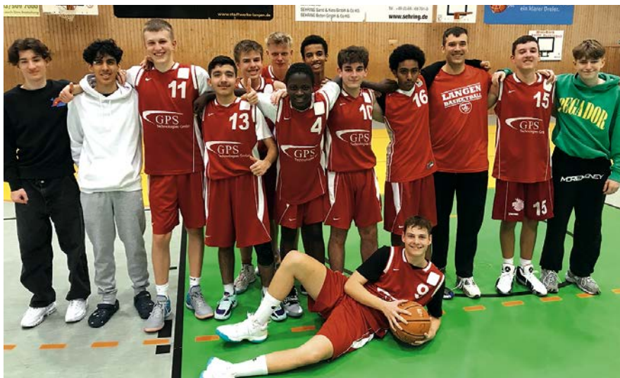
Die U16-2-Jungs in bester Besetzung