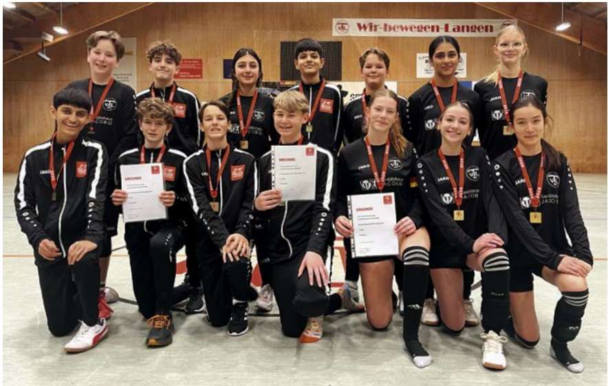
Unsere Jugend U14

Der TV Langen stellte in der U14 drei Teams, die alle unterschiedliche, aber erfolgreiche Wege gingen. Das erste Team sicherte sich nach einer durchwachsenen Saison und spannenden Spielen am letzten Spieltag die Vizehessenmeisterschaft . Das zweite Team, unterstützt durch Spielerinnen der U14, sammelte wertvolle Erfahrung und konnte mit einem guten vierten Platz überzeugen. Die weibliche U14 behauptete sich beeindruckend in der Jungklasse und gewann mehrere Spiele, was in der Endwertung Platz fünf bedeutete. Sowohl die weibliche U14 als auch die erste Mannschaft qualifizierten sich damit für die Mitteldutschen Meisterschaften in Leipzig.