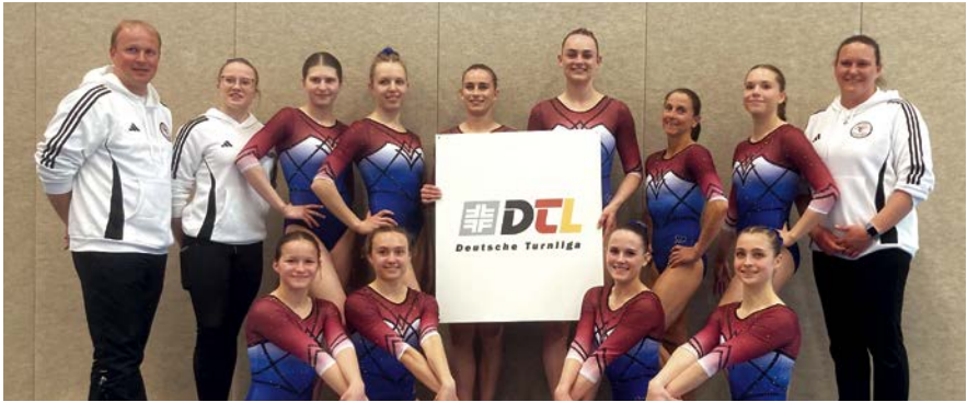
Das neu formierte Team Langen-Bad Homburg

Die Damen starteten souverän am Zittergerät, dem Schwebebalken, in den Wettkampf und konnten trotz zweier in die Wertung einfließender Stürze, eines der höchsten Team-Ergebnisse an diesem Gerät erzielen. Auch am Boden überzeugten sie das Kampfgericht mit sauberen Übungen. Und obwohl der Stufenbarren im Vergleich zu den anderen Teams nicht ganz optimal verlief, holten die Damen am Sprung nochmal alles heraus und erturnten sich hier das mit Abstand höchste Teamergebnis des Tages. Alles in allem steht damit ein herausragender vorläufiger 3. Platz zu Buche, dessen Erhaltung nun auf jeden Fall an erster Stelle steht!