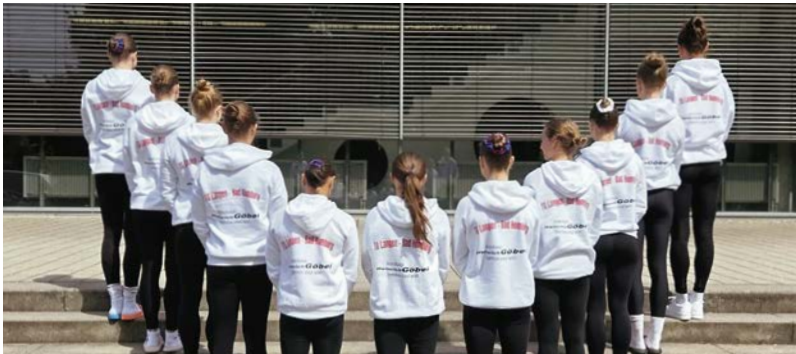
Herzlichen Dank an das Autohaus Heinrich Göbel

Im Namen beider Vereine sowie aller Turnerinnen möchten wir uns zudem herzlich beim Autohaus Heinrich Göbel für das großzügige Sponsoring der Team-Pullis und die damit verbundene Unterstützung bedanken.