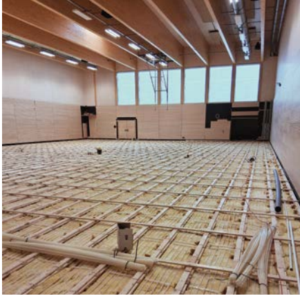
1-Feld-Halle Fußboden Unterkonstruktion mit Dämmung und Fußbodenheizung