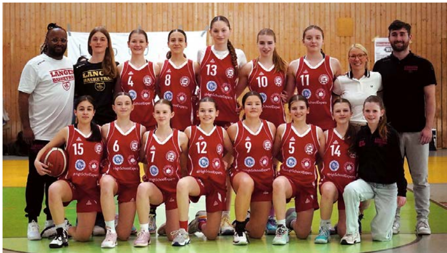
Die U14-Mädchen auf dem Weg zur Meisterschaft