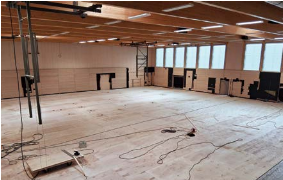
In der 3-Felder-Halle ist der Boden schon fast geschlossen