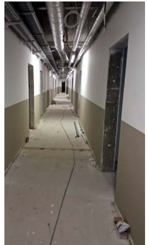
Saubergang vor den Kabinen