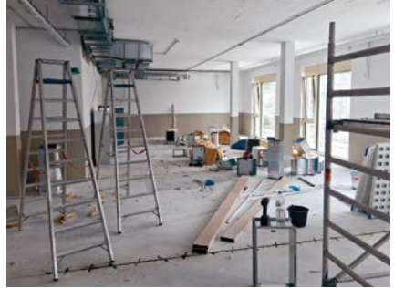
Der Krafraum dient noch als Lagerfläche