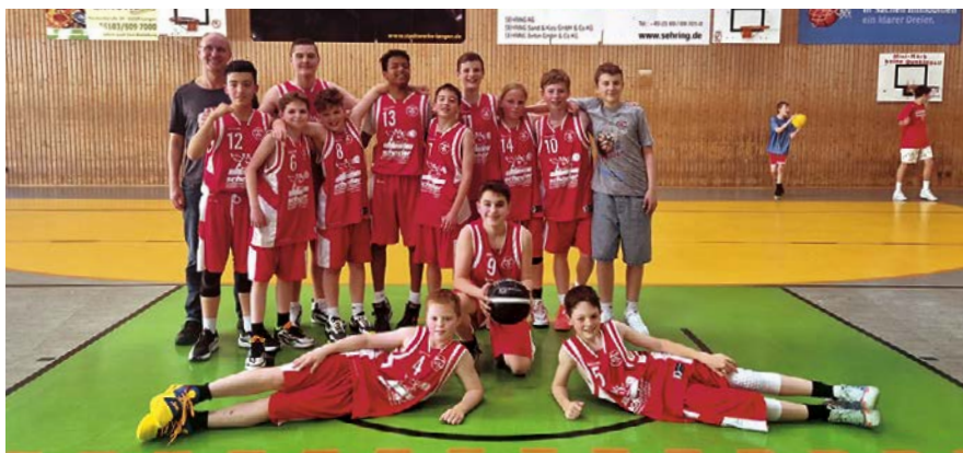
Die U14-Jungen in ihrer Erfolgs-Saison