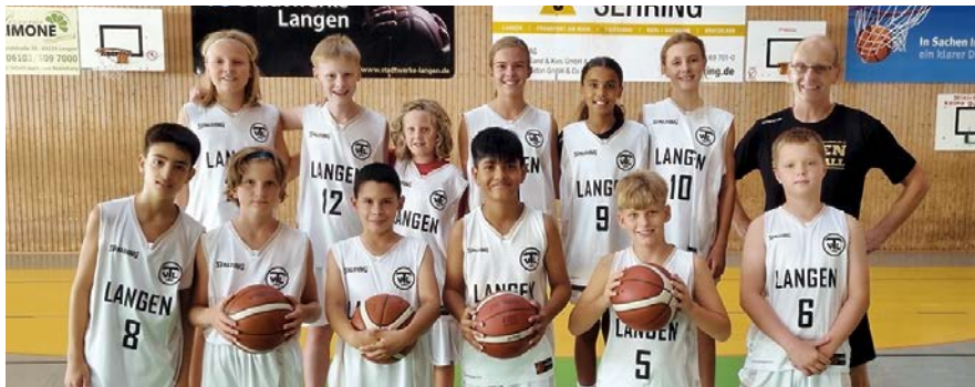
Die U12-Mix mit dem 2. Platz im Wiener Osterturnier

Alle Basketball-Gruppen freuen sich auf die Ersatzhalle der Georg-Sehring-Halle: Nicht nur die 27 aktiven Teams, die an Punktspielen teilnehmen, füllten die Hallen (Georg-Sehring-Halle sowie Gymnasiums-Hallen neu und alt). Mit regelmäßigen Trainings füllten die drei Hallen auch die TRIMM-Damen und TRIMM-Herren sowie die Senioren-Herren und sehr zahlreich die U6- sowie U8-Kinder (letztere mit jeweils zwei Gruppen). Sie alle hoffen nach dem Hallen-Neubau darauf, die bisher besetzten Hallen frei zu geben und in die neue Halle zu wechseln.