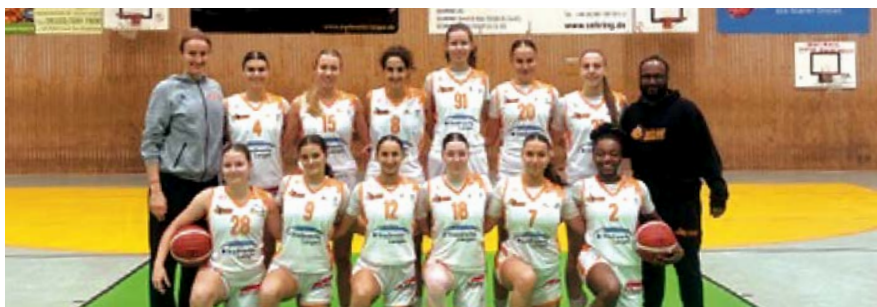
RMB-Damen, als noch alle gesund und fit waren