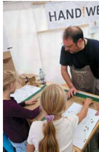
Workshops und Bastelstationen animierten die Kinder zum Mitmachen.

Frankfurt Skyliners füllten den Platz mit Staunen und Begeisterung. Der Geburtstagskuchen für alle wurde durch die Handwerkskammer gespendet. Bäckerei Eifler hatte 2.500 Streuselstückchen gebacken und diese wurden an alle Gäste verteilt. Neben der Bühne luden Partner wie das Senckenberg Naturmuseum, die Schirn Kunsthalle