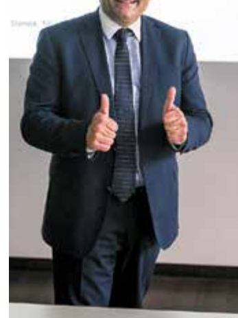
Prof. Dr. Dr. med. Donas.

ren eröffnete sich Möglichkeit zur Etablierung des Asklepios Rhein-Main Gefäßzentrums, das mittlerweile über drei Standorte in den Asklepios Kliniken Langen, Seligenstadt und Wiesbaden verfügt. „Mit unserem Konzept „Gefäßmedizin aus einer Hand“, das minimal invasive Techniken