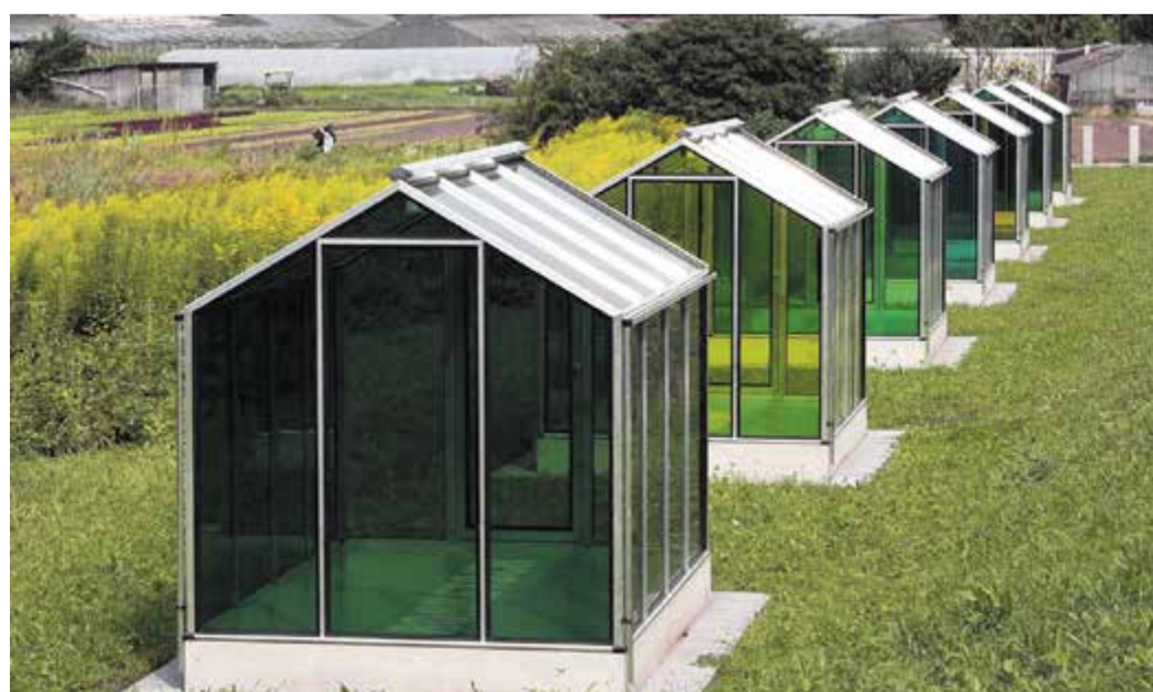
Sieben grüne Gewächshäuser als Symbol für die traditionellen Kräuter

Wer in Oberrad unterwegs ist, kommt an einer besonderen Hommage kaum vorbei: dem Grüne-Soße-Denkmal. Sieben weiße Gewächshäuser auf einem kleinen Hügel symbolisieren die sieben Kräuter der berühmten Frankfurter Grünen Soße – Petersilie, Schnittlauch, Kresse, Borretsch, Pimpinelle, Sauerampfer und Kerbel. Ein liebevoll gestalteter Ort, der nicht nur Einheimische stolz macht, sondern auch Besucher neugierig werden lässt.