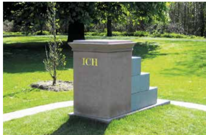
Hier stellt man sich selbst in den Mittelpunkt

Am Mainufer in Oberrad regt das Ich-Denkmal zum Nachdenken an. Statt einer historischen Figur oder eines großen Ereignisses feiert dieses Denkmal das „Ich“ – jede und jeden von uns.