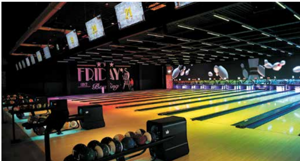
Friday's Bowling Center mit dem Launch-Charakter ist eine gelungene Kombination aus Erlebniswelt und Freizeitsport.

Ab 1. Oktober geht es im Friday's Bowling Center auf 25 Bahnen los