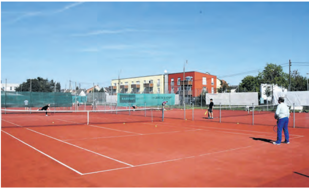
Blick über die Tennisanlage des TAV Eppertshausen während des Schnuppertrainings am vergangenen Samstag. Diese Sparte des Turn-Athletik-Vereins hat im September erste Belebungsversuche unternommen. Am heutigen Donnerstag (25.) sucht der TAV erneut neue Personen für den Vorsitz und das Rechneramt.

Nun schaut man wieder optimistischer in die Zukunft. „Wir