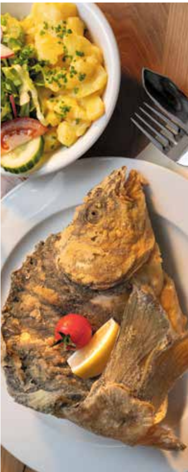
Der Aischgründer Spiegelkarpfen ist eine regionale Delikatesse.

Direkt im Anschluss starten die Wildbretwochen: Den gesamten November servieren Gastwirte im Landkreis Neustadt an der Aisch-Bad Windsheim Klassiker wie Reh- oder Wildschweinbraten und ausgefallene Kreationen wie Wildessenz mit Mangoldröllchen mit Fleisch aus heimischen Revieren.