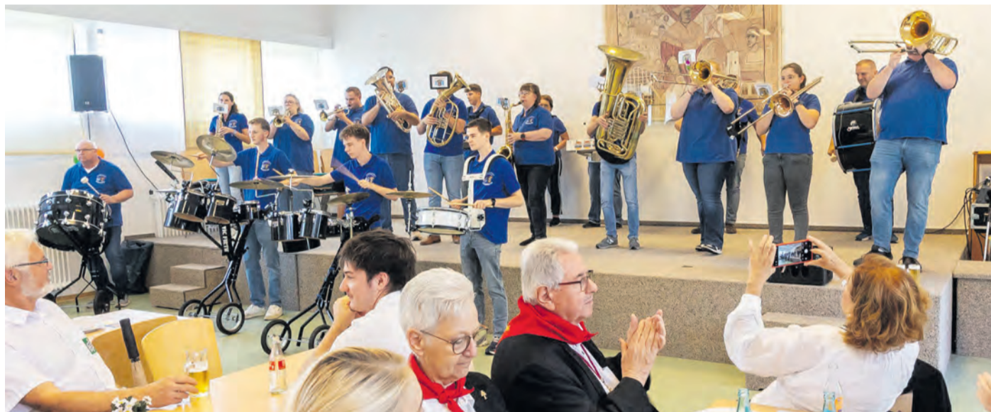
Auftritt des Karl-Mayer-Orchesters im Pfarrsaal.

Für das leibliche Wohl sorgte wieder der Förderverein der Kita St. Thomas Morus mit frisch gegrillten Würstchen und knusprigen Pommes, der Kirchenchor bot eine große Getränkeauswahl, die Kickers Obertshausen sorgten für frisches Bier vom Fass und der Freundeskreis der KJO hielt eine große Kuchenauswahl und den passenden Kaffee bereit.