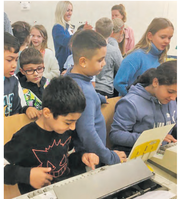
Einige Viertklässler der Waldschule beim Ausprobieren der Texterfassung an den ZVB-Schreibmaschinen.