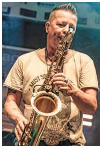
auf der Volksbank-Bühne: westernBEhagen