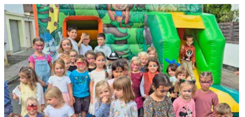
Die Kinder der Kita Neckarstraße in Nauheim freuten sich über eine aufblasbares Sport- und Spielgerät