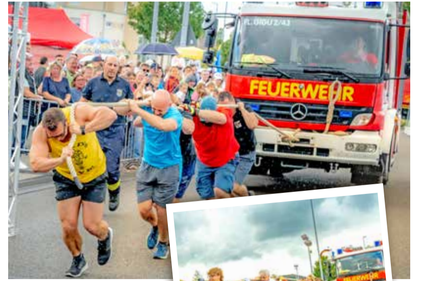
„0,5 PS“ gewinnen die Truck-Pulling-Challenge 2025

Mit Partyband „Bravo #5“, Hüpfburg, Kinderschminken, Fahrzeugausstellung und vielen kulinarischen Angeboten war für jedes Alter etwas dabei. Der Andrang war so groß, dass selbst die Crêpes-Eisen und die Kinderschminker kaum hinterherkamen. An den ausgestellten Einsatzfahrzeugen entstanden zahlreiche Erinnerungsfotos und angeregte Gespräche über die Arbeit der Feuerwehr.