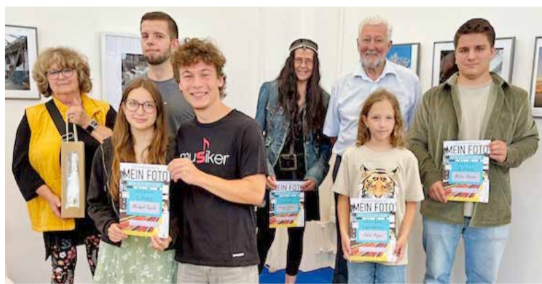
Gruppenfoto der Preisträger