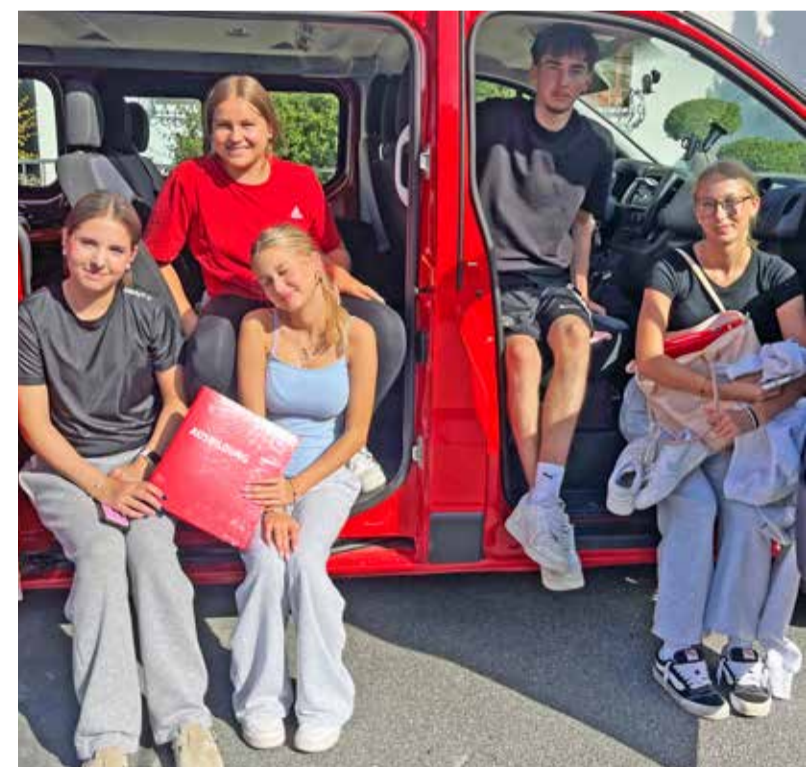
Die TSV-Jugend beim Grundmodul in Büttelborn – voller Einsatz und viel Teamgeist.

TSV Ginsheim – Am 07.09. absolvierte die TSV-Jugend das Grundmodul des Hessischen Turnverbands in Büttelborn – die Vorstufe zur Übungsleiterlizenz. Zwei Wochenenden lang zu Gast beim TV Büttelborn, erhielten die Jugendlichen Einblicke in Methodik, Didaktik, Trainingslehre, Aufsichtspflicht und Physiologie. Praxisorientierte Spiele und Zirkel-einheiten rundeten das Programm ab. Zum Abschluss meisterten alle eine Lernerfolgskontrolle. Nun folgt