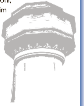
Herausgegeben von der Gemeinde Bischofsheim

Am 27.9., von 11 bis 12 Uhr, findet die Tauschbörse im Obergeschoss der Bücherei statt. Es können Pokemon-Karten sowie andere Sammelkarten für Kinder untereinander getauscht werden.