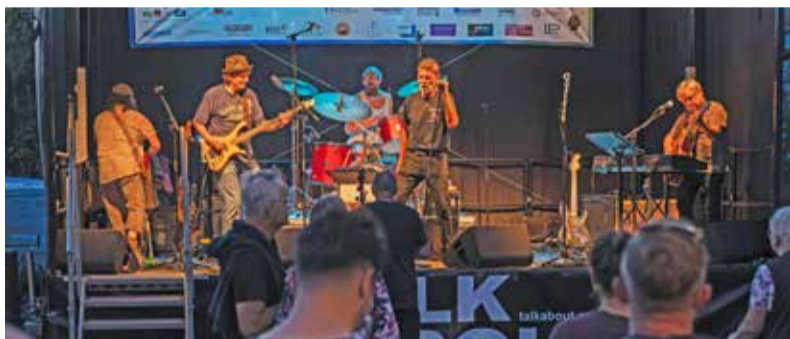
auf der Weindorf-Bühne: Talk About