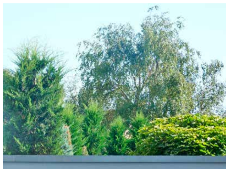
Foto Nr. 18: Von wo genau fällt hier der Blick in der Darmstädter Straße auf das Grün? Mit solchen Fragen und den dazu gehörenden Fotos müssen sich die Teilnehmer auseinandersetzen.