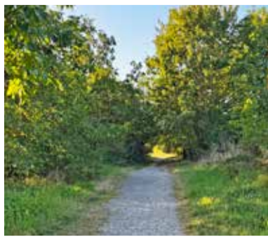
Derzeit führt lediglich ein geschotterter Gehweg durch den Bansen.