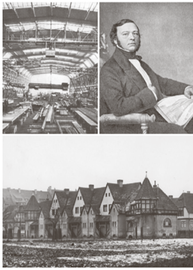
der MAN-Konzern hervorging, trieb er den Fortschritt voran und prägte