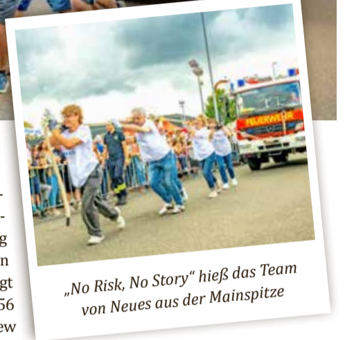
„No Risk, No Story“ hieß das Team von Neues aus der Mainspitze

siegel entwickelte Lichtschrankenanlage. Die Ergebnisse waren denkbar knapp: Den Sieg holte sich das Team 0,5 PS in 24,884 Sekunden, dicht gefolgt von der RSG Ginsheim (24,556 Sekunden) und der Monaco Crew (24,979 Sekunden). Damit trennten die ersten drei Plätze weniger als eine halbe Sekunde. Unter den Teilnehmern waren erstmals gleich zwei reine