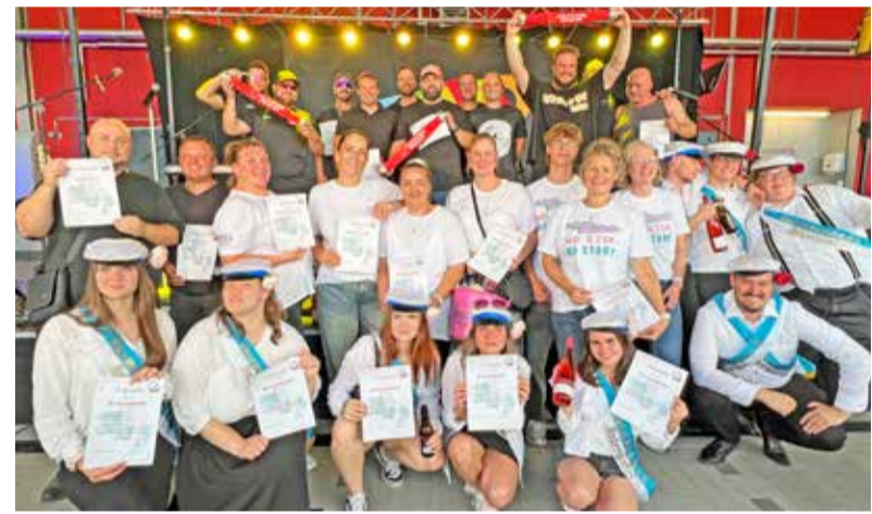
Die Teilnehmer der Truck Pulling Challenge