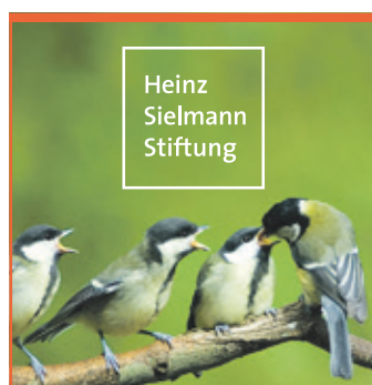
Heinz Sielmann Stiftung

Postagentur & Kiosk am Bahnhof Bahnhofstr. 2A