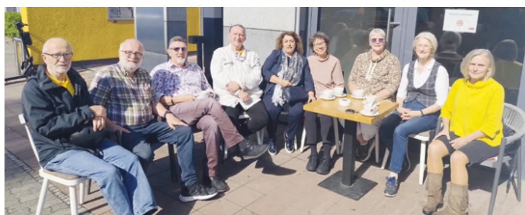
Der neugewählte Vorstand des Förderverein Kranichstein e.V. plant bei seiner 1. Open Air Sitzung den Kranichsteiner Abend 2025.

Verleihung des „Goldenen Kranich“ und „Gemeinsames Singen mit Andreas Sommer“ am 07.11. im ÖGZ