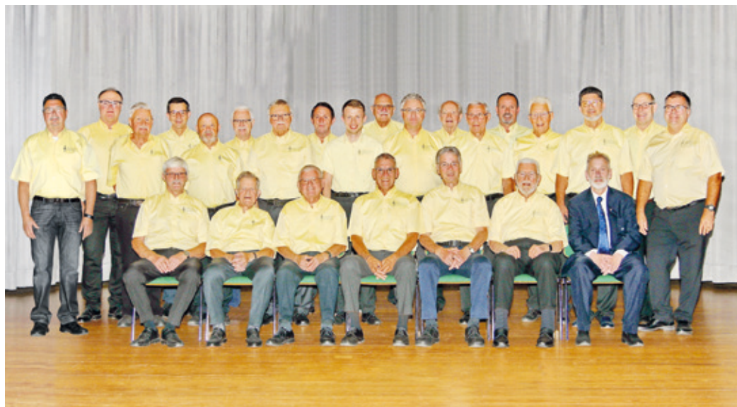
Der Erzhäuser Männerchor im Jubiläumsjahr 2025.

Der Erzhäuser Männerchor lädt ein zum 150-jährigen Jubiläum