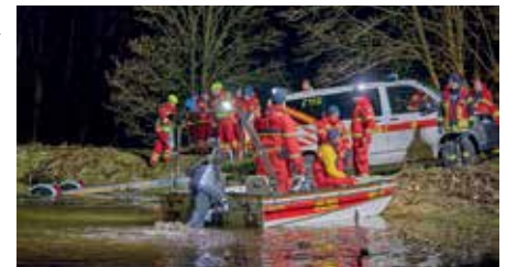
Voller Einsatz, doch Versicherungsschutz und finanzielle Entschädigungen sind nicht für alle Helfer gleich definiert.

gen im Katastrophenschutz sowie für die örtliche Gefahrenabwehr bundesweit zu vereinheitlichen.