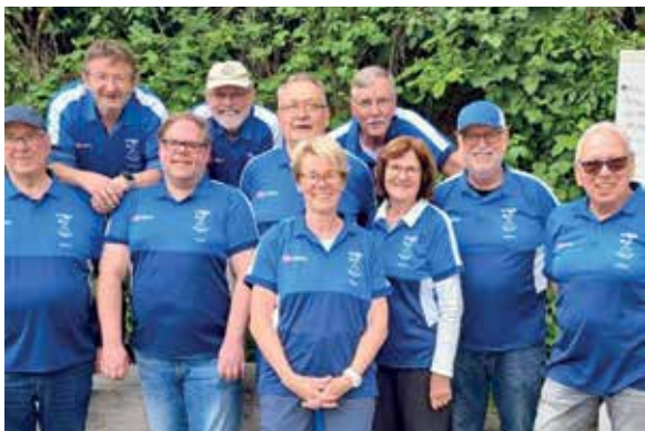
Mit guter Laune, Teamgeist und Zielwasser: Die Boulemannschaft der KSG Bönstadt bei einem Hessenliga-Spieltag.

Bönstadts Boulemannschaft begeistert mit Leidenschaft und Spielfreude – Training für Interessierte immer dienstags