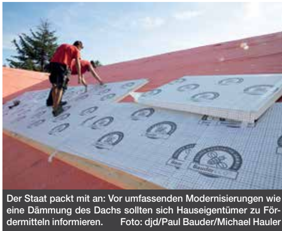
Der Staat packt mit an: Vor umfassenden Modernisierungen wie eine Dämmung des Dachs sollten sich Hauseigentümer zu Fördermitteln informieren.

(djd). Wer sein Eigenheim modernisiert, somit nachhaltig Energie spart und zum Klimaschutz beiträgt, kann staatliche Zuschüsse in Anspruch nehmen. Allerdings: Viele Eigentümer verschenken bares Geld, ob aus Unwissenheit, weil Anträge zu spät oder fehlerhaft gestellt werden. Vielen ist beispielsweise nicht bekannt,