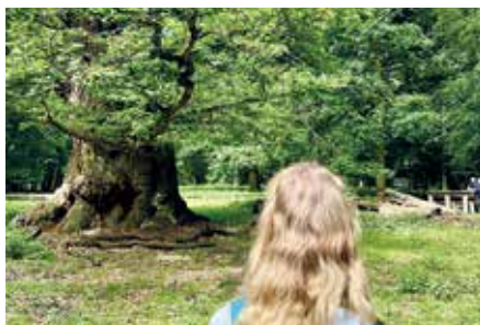
Unter dem Motto „Gemeinsam! Für den Wald.“ gibt es bei den Deutschen Waldtagen 2025 bundesweit viel zu entdecken.

Forstwirtschaftsrat statt. Unter www.deutsche-waldtage.de gibt es weitere Informationen.