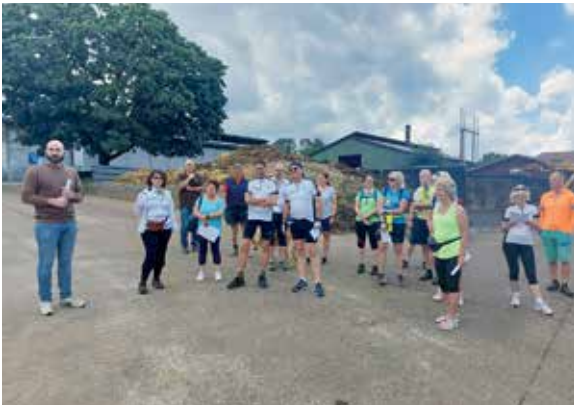
Das GRÜNE Team beim Besuch der Biogasanlage der Familie Orth in Ober-Seemen.

Mit über 19.700 km zum 5. Sieg in Folge im Wetteraukreis