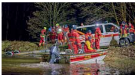
Voller Einsatz, doch Versicherungsschutz und finanzielle Entschädigungen sind nicht für alle Helfer gleich definiert.

im Katastrophenschutz sowie für die örtliche Gefahrenabwehr bundesweit zu vereinheitlichen.