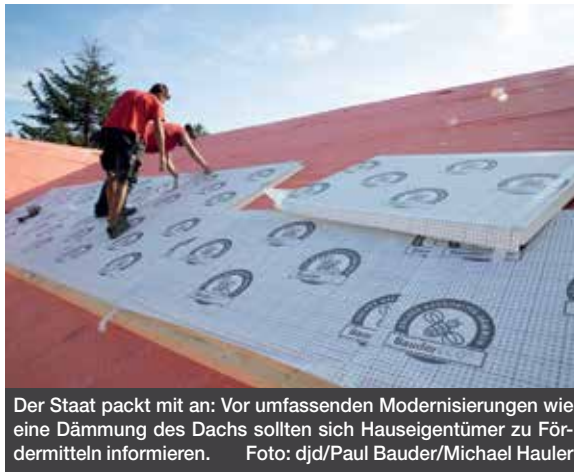
Der Staat packt mit an: Vor umfassenden Modernisierungen wie eine Dämmung des Dachs sollten sich Hauseigentümer zu Fördermitteln informieren.

(djd). Wer sein Eigenheim modernisiert, somit nachhaltig Energie spart und zum Klimaschutz beiträgt, kann staatliche Zuschüsse in Anspruch nehmen. Allerdings: Viele Eigentümer verschenken bares Geld, ob aus Unwissenheit, weil Anträge zu spät oder fehlerhaft gestellt werden. Vielen ist beispielsweise nicht bekannt,