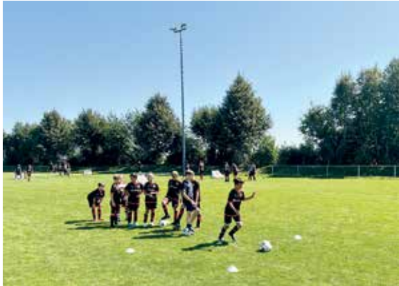
Bereits zum zehnten Mal fand in der letzten Sommerferienwoche auf der Sportanlage der SG Rodheim

Weitere Informationen und Anmeldung über www.kraniche-florstadt.de oder per E-Mail an info@kraniche-florstadt.de .