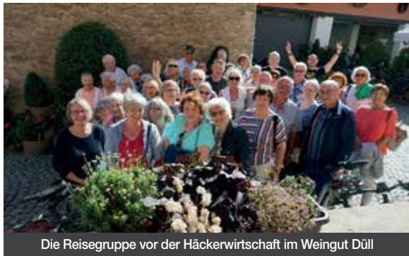
Die Reisegruppe vor der Häckerwirtschaft im Weingut Düll

Die traditionelle Tagesfahrt des Kleintierzuchtvereins H 259 Ilbenstadt führte in diesem Jahr ins fränkische Weinland. Bei sonnigem Wetter startete die Gruppe mit dem traditionellen