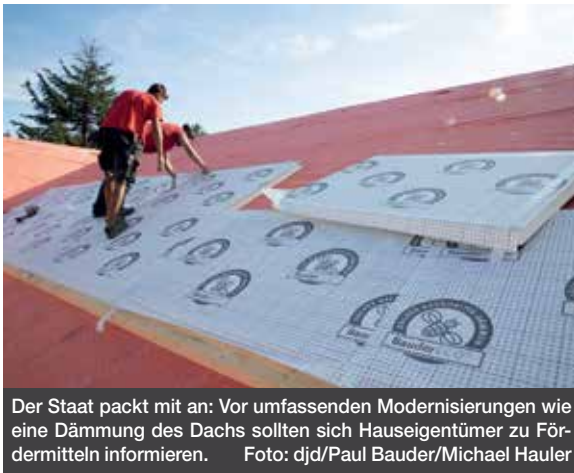
Der Staat packt mit an: Vor umfassenden Modernisierungen wie eine Dämmung des Dachs sollten sich Hauseigentümer zu Fördermitteln informieren.

(djd). Wer sein Eigenheim modernisiert, somit nachhaltig Energie spart und zum Klimaschutz beiträgt, kann staatliche Zuschüsse in Anspruch nehmen. Allerdings: Viele Eigentümer verschenken bares Geld, ob aus Unwissenheit, weil Anträge zu spät oder feh-