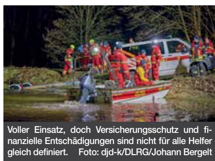
Voller Einsatz, doch Versicherungsschutz und finanzielle Entschädigungen sind nicht für alle Helfer gleich definiert.

Eine Grundausstattung an Werkzeugen und Materialien ist vorhanden. Wer möchte, kann eigenes (Taschen-)Messer, Äste, Schwemholz oder Resthölzchen mitbringen. Die Teilnehmerzahl ist begrenzt, daher wird um vorherige telefonische Anmeldung bei H. Genau unter 0151 219 28 406 gebeten (nur beim ersten Besuch erforderlich).