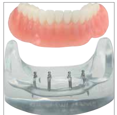
Modell Mini-Implantate / Zahnprothese: Schonend implantierbare Stifte verbinden den Kiefer mit der Prothese und sorgen für festen Sitz. Grafik: 3M Deutschland GmbH

Einfach und unproblematisch ist auch das Einsetzen von Mini-Implantaten. Da die