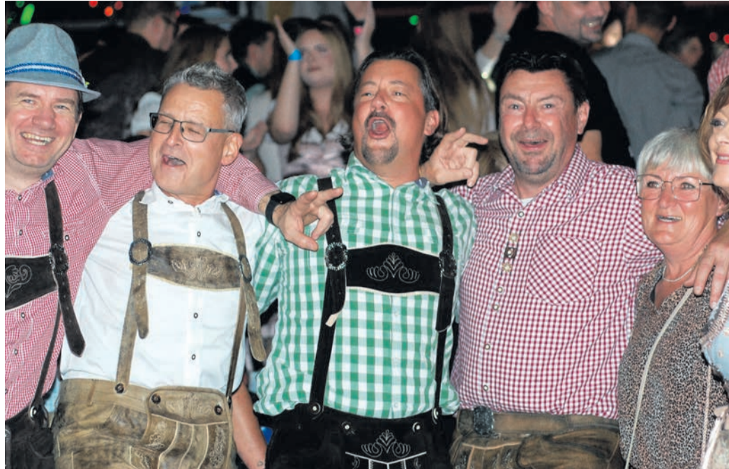
Münster kann bayerisch feiern und ist mit Lederhosen und Dirndl gut eingedeckt. Das bewies das jüngste Oktoberfest der Wehr.