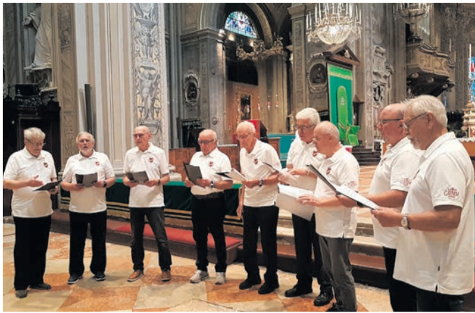
Das „Codigoro-Ensemble“ der Germania in der Kathedrale von Ferrara.

Eppertshausen (EA) Nach 2008 und 2016 nahm der Gesangsverein Germania endlich wieder an einer Fahrt des Partnerschaftsvereins Codigoro-Eppertshausen in die italienische Partnergemeinde teil. Der Anlass dieser Fahrt diente der weiteren Vertiefung der langjährigen und intensiv gepflegten Freundschaft der Menschen beider Kommunen. Der Zeitrahmen dieser Reise wurde von den Organisatoren bewusst auf die Festtage der „Fiera di Santa Croce“, dem traditionellen Fest von Codigoro gelegt. Diese auch für die Umgebung bedeutende Veranstaltung fand in diesem Jahr vom 12. bis 16. September statt und lud mit einem breitgefächerten Kulturprogramm u.a. mit Konzerten und Ausstellungen ein. Auch ein Flanierbereich mit verschiedenen Ständen, an dem man sich kulinarisch verwöhnen lassen oder ausgiebig shoppen konnte, gehörte zum Angebot. Das absolute Highlight am Samstagabend bildete eine Kombination aus Lagershow, Feuerwerk, passender Musik und einem Korso von zahlreichen Kanus mit Fackeln am bzw. auf dem Po di Volano. Der ehemalige Mündungsarm des Flusses Po fließt durch die malerische Gemeinde und diente bei dieser sagenhaften Inszenierung gleichermaßen