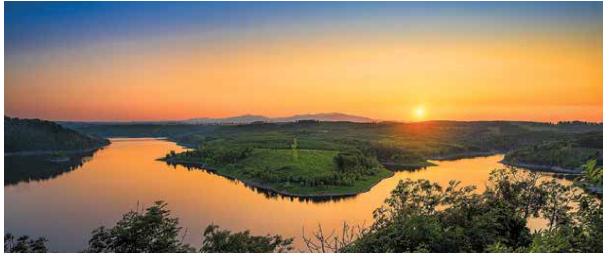
Vom Aussichtspunkt am Rotestein reicht der Blick über den Rappbodestausee bis zum Wurmberg und zum Brocken.

Die Hotels der Region bieten ihren Gästen private kleine Spa-Bereiche, Infrarot- oder Fass-Saunen und exklusive Entspannungsangebote – etwa Massagen, kosmetische An-