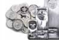
Silbermünzen und -barren