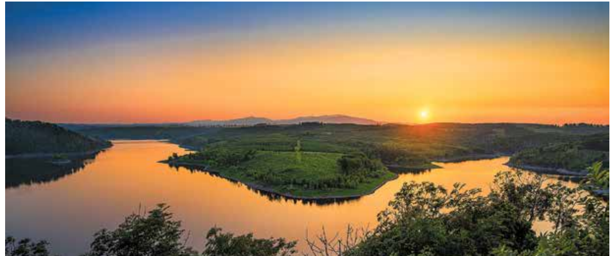
Vom Aussichtspunkt am Rotestein reicht der Blick über den Rappbodestausee bis zum Wurmberg und zum Brocken.

Die Hotels der Region bieten ihren Gästen private kleine Spa-Bereiche, Infrarot- oder Fass-Saunen und exklusive Entspannungsangebote – etwa Massagen, kosmetische An-