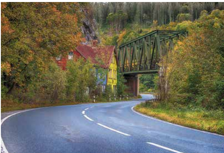
In den engen Tälern im Oberharz lehnen sich alte Holzhäuser aneinander.

Erde: Das Weihnachtsprogramm in der Baumannshöhle lädt die ganze Familie zu kurzweiligen Veranstaltungen ein. Im außergewöhnlichen Ambiente des Goethesaals wird die „Weihnachtsgeschichte“ als Erlebnis-Theater präsentiert und bis in den Februar steht das Märchen „Die Schneekönigin“ auf dem Programm. Am 21. Dezember erfüllt das Vokalensemble LaBaZi bei einem Weihnachtskonzert die geheimnisvollen Höhlen mit magischen Klängen.