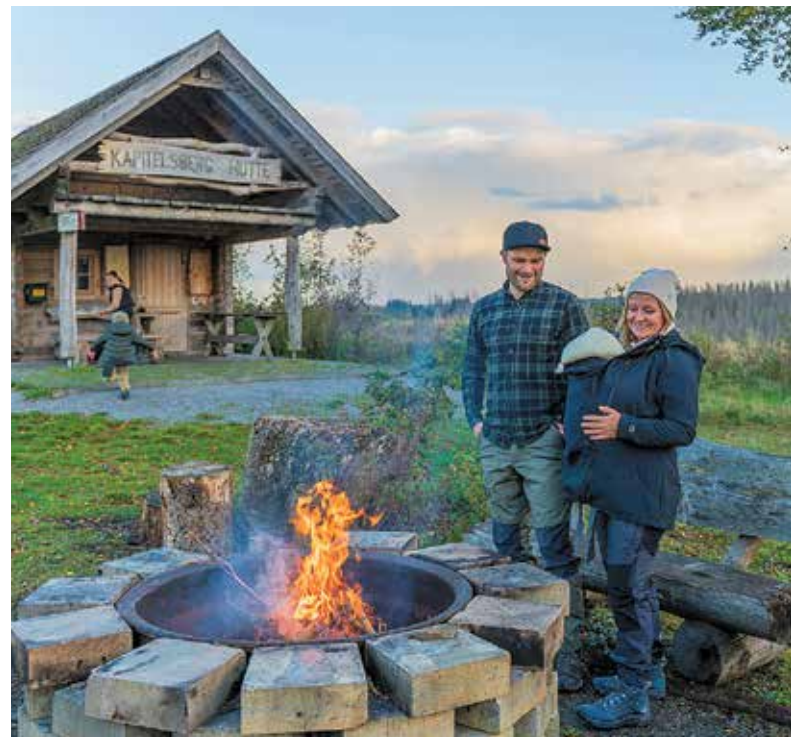
Abseits vom touristischen Trubel finden Wanderer und Naturfreunde gut ausgestattete Schutzhütten.