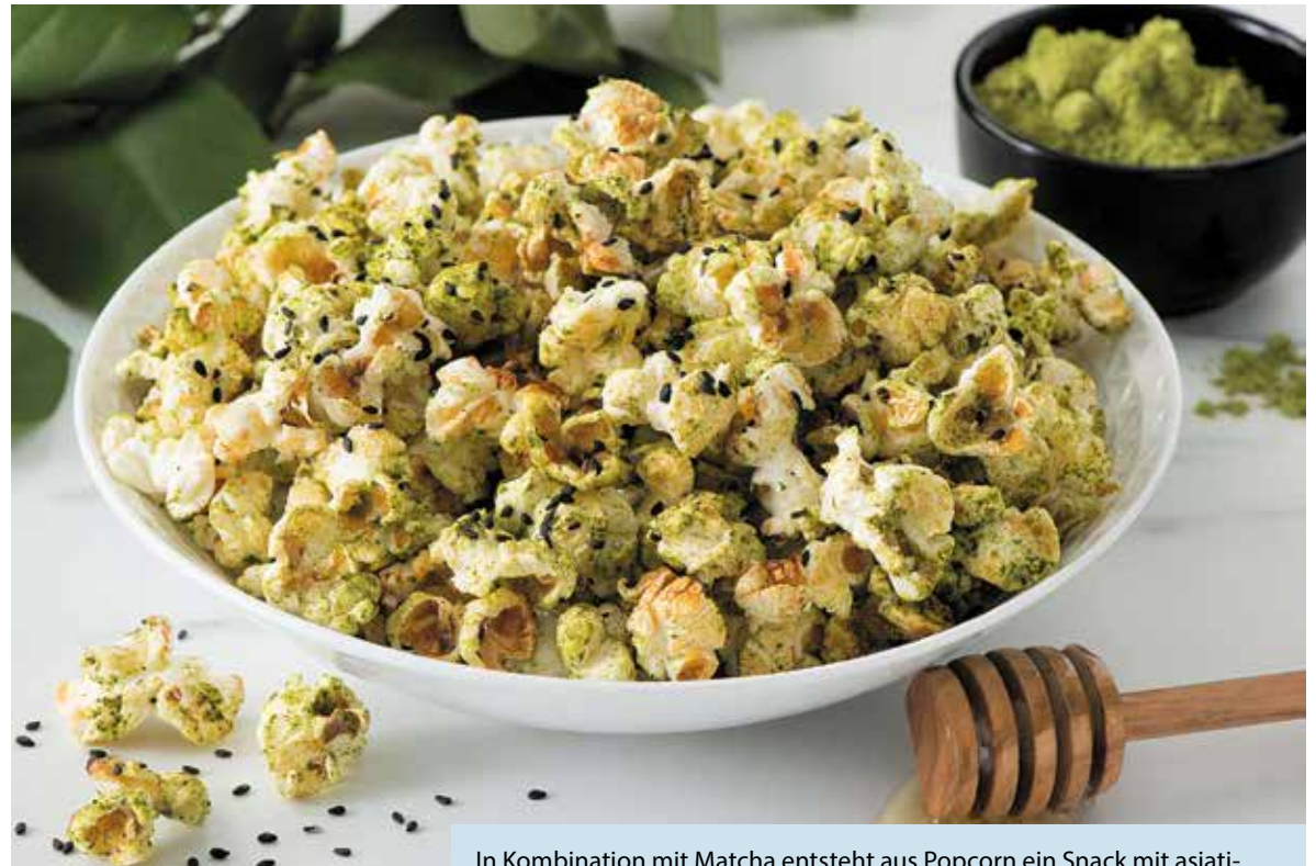
In Kombination mit Matcha entsteht aus Popcorn ein Snack mit asiatischem Twist: süß, herb, aromatisch.

3. 25 bis 30 Minuten backen, dabei gelegentlich umrühren, bis das Popcorn trocken ist. Vollständig abkühlen lassen und genießen.