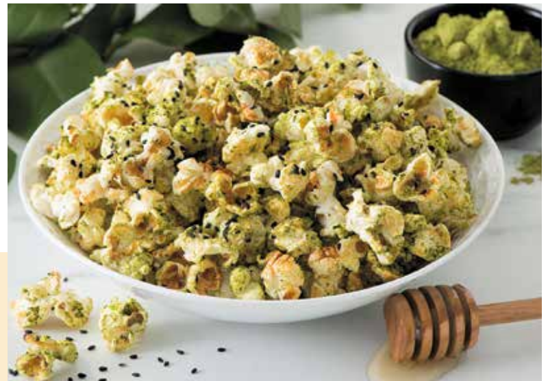
In Kombination mit Matcha entsteht aus Popcorn ein Snack mit asiatischem Twist: süß, herb, aromatisch.

Tipp: Am besten schmeckt das Honig-Matcha-Popcorn, wenn man auch das Popcorn selbst macht. Besonders gut eignet sich dafür Popcornmais aus den USA. Er wird ohne Gentechnik produziert, enthält wichtige Nährstoffe wie Ballaststoffe und Antioxidantien und ist vielseitig einsetzbar, wie zahlreiche Rezepte unter www.popcorn.org zeigen. Auf der Website gibt es auch eine Anleitung, wie man Popcornmais in einem Topf auf dem Herd perfekt zum Poppen bringt, ohne dass er anbrennt.