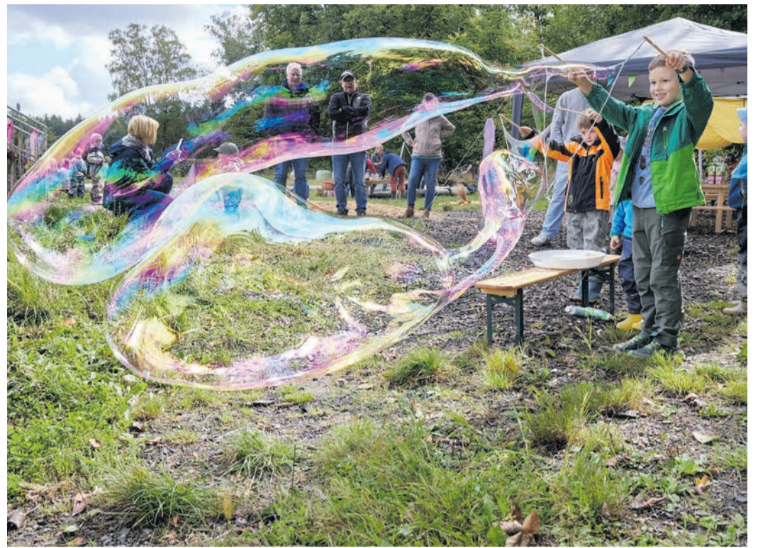
Riesen-Seifenblasen, Zaubersand und gute Stimmung führten die Besucherinnen und Besucher des Herbstfestes der Waldkitagruppe Wildkatzen der AWO Obertshausen zusammen.

„Der Herbst ist da, er bringt uns Spaß, rüttelt an den Zweigen, lässt den Drachen steigen“ intonierte sie das passende Lied aus dem von der AWO Obertshausen herausgegebenen Heft